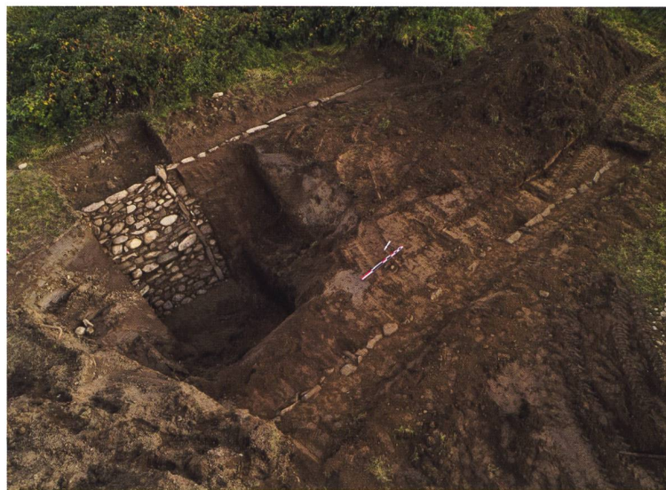
15 Bellinzona. Il fossato della Ridotta Saleggio.