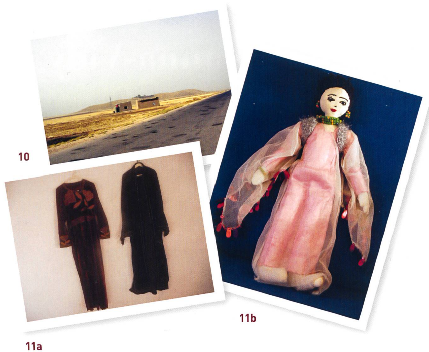
10 Due casette monocamere adibite a mostra e atelier; il sito di Mozan sullo sfondo.