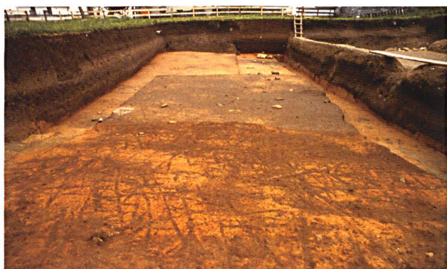
5 Tracce d'aratura attribuibili all'età del Rame, emerse a Castaneda-Pian del Remit

tra scheggiata del Neolitico e dell'età del Rame. È probabile che le necropoli furono allestite in un luogo frequentato millenni prima da gruppi neolitici.