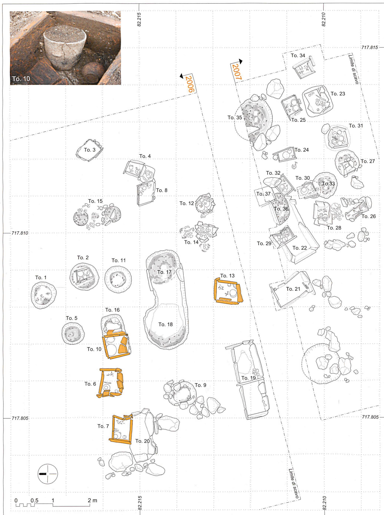
1 Planimetria generale della necropoli di Tremona a fine scavo e dettaglio fotografico della tomba 10 (elaborazione grafica e foto UBC, F. Ambrosini)