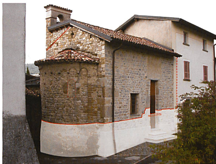
3 Dettaglio della facciata laterale dell'oratorio di Novazzano con evidenziata la fase romanica (foto ed elaborazione grafica UBC, D. Calderara - F. Ambrosini)

Il restauro ha lasciato la muratura a vista, così che ancora oggi si può leggere la struttura originaria della chiesa romanica completata poi nelle fasi successive con l'apertura di una grande finestra e l'aggiunta di tre gradini per colmare il dislivello fra esterno e interno.