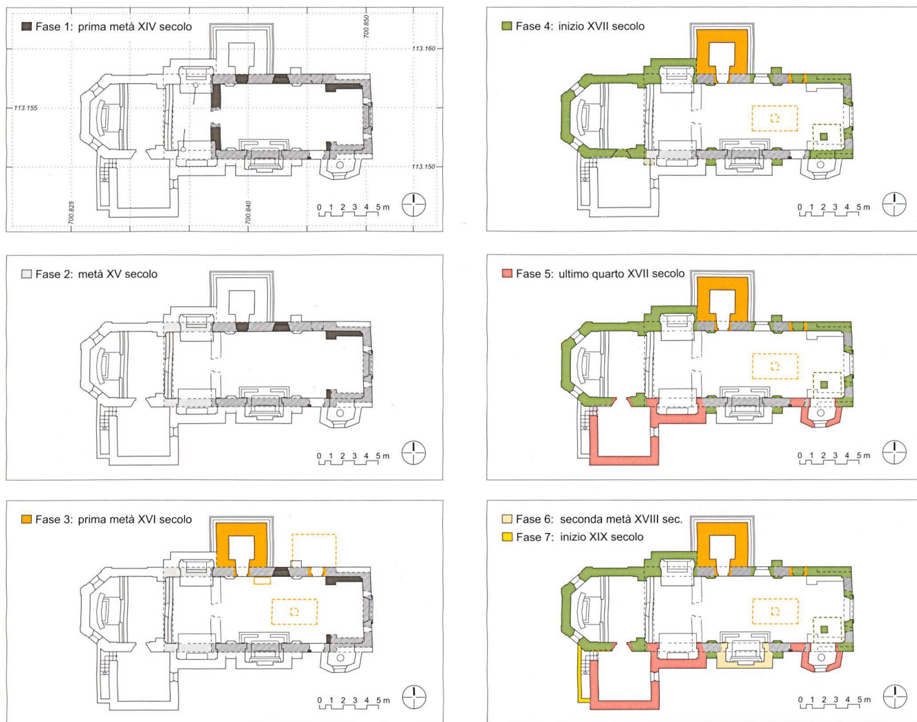
2 Schema con le diverse fasi costruttive della chiesa di Losone-Arcegno (elaborazione grafica UBC, F. Ambrosini)