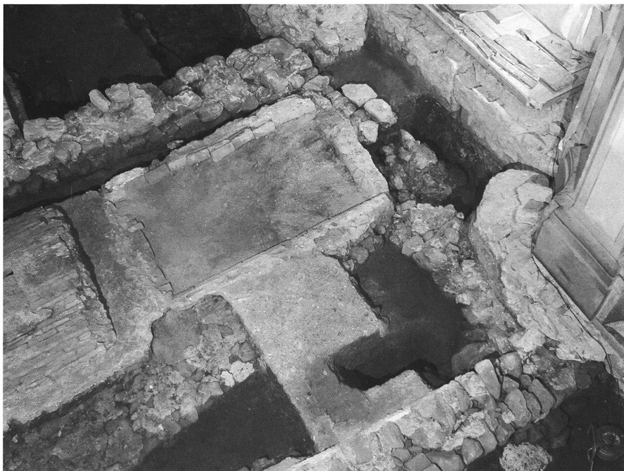
Veduta generale della chiesa romanica, con in primo piano i sepolcri del Seicento