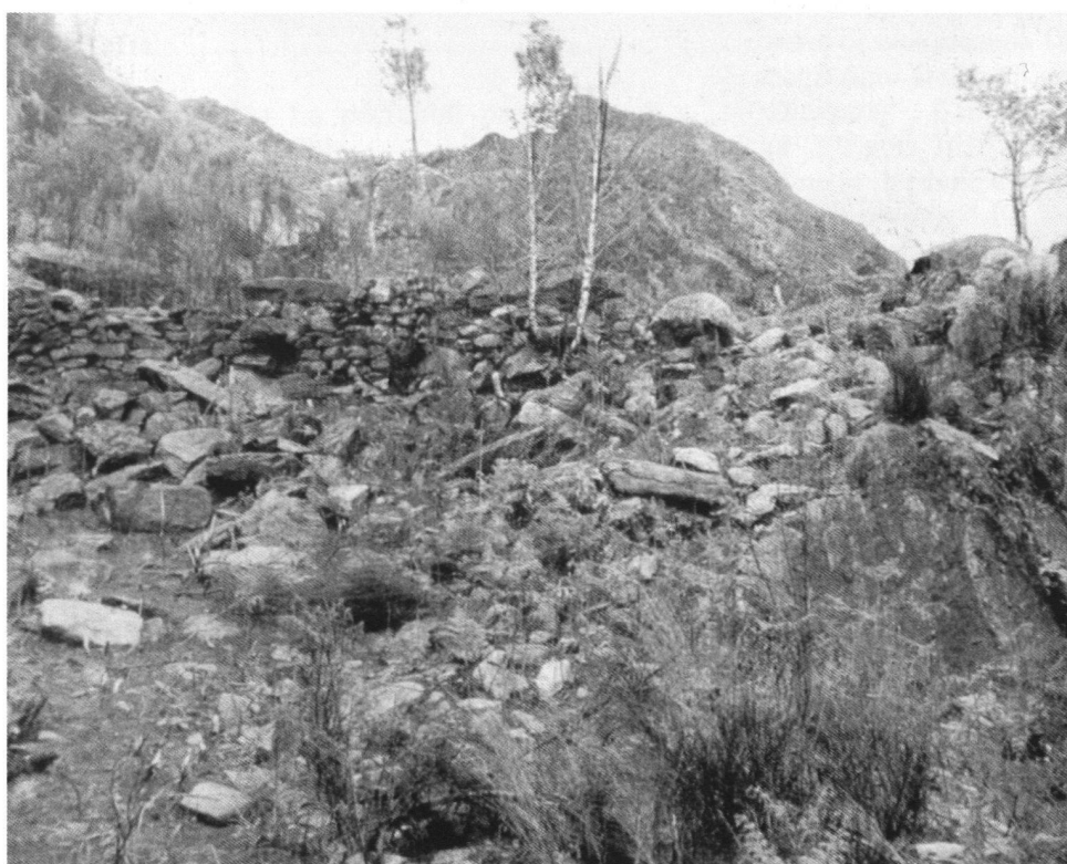
Particolare delle emergenze murarie all'epoca delle ricerche del Frick