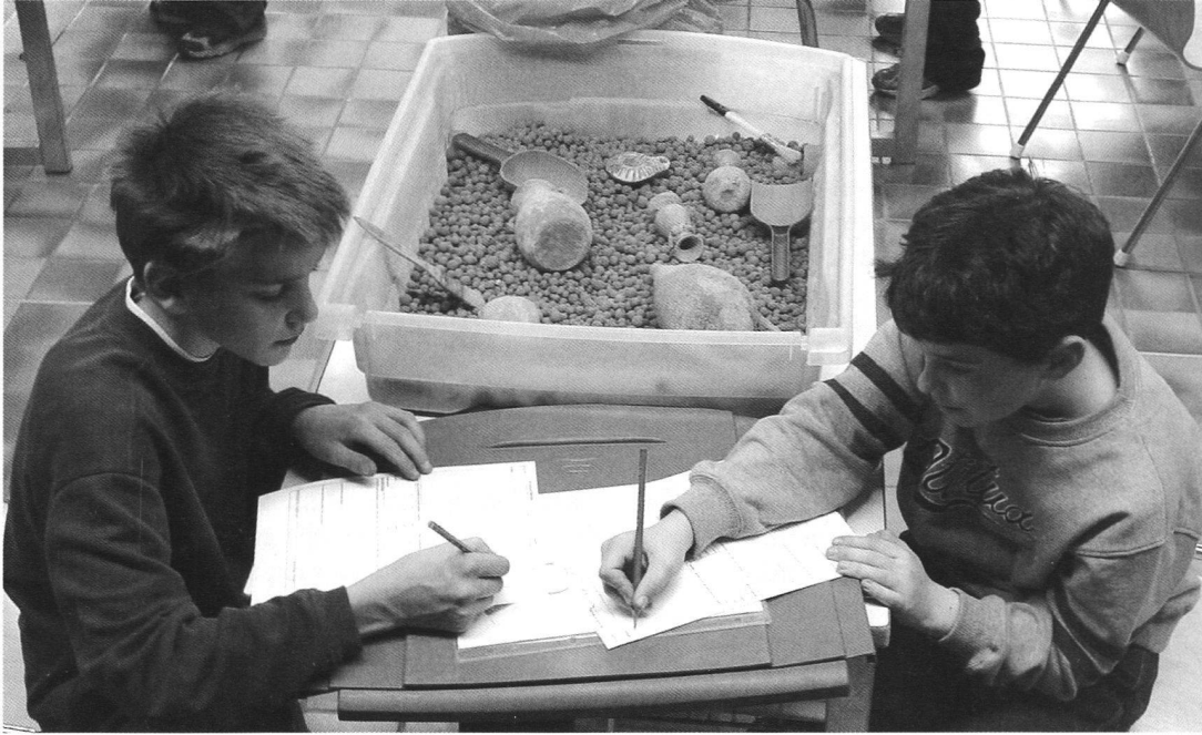
La simulazione delle fasi dello scavo archeologico durante la lezione/laboratorio "Il detective della memoria"