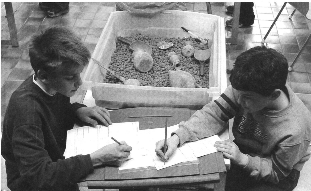
La simulazione delle fasi dello scavo archeologico durante la lezione/laboratorio "Il detective della memoria"