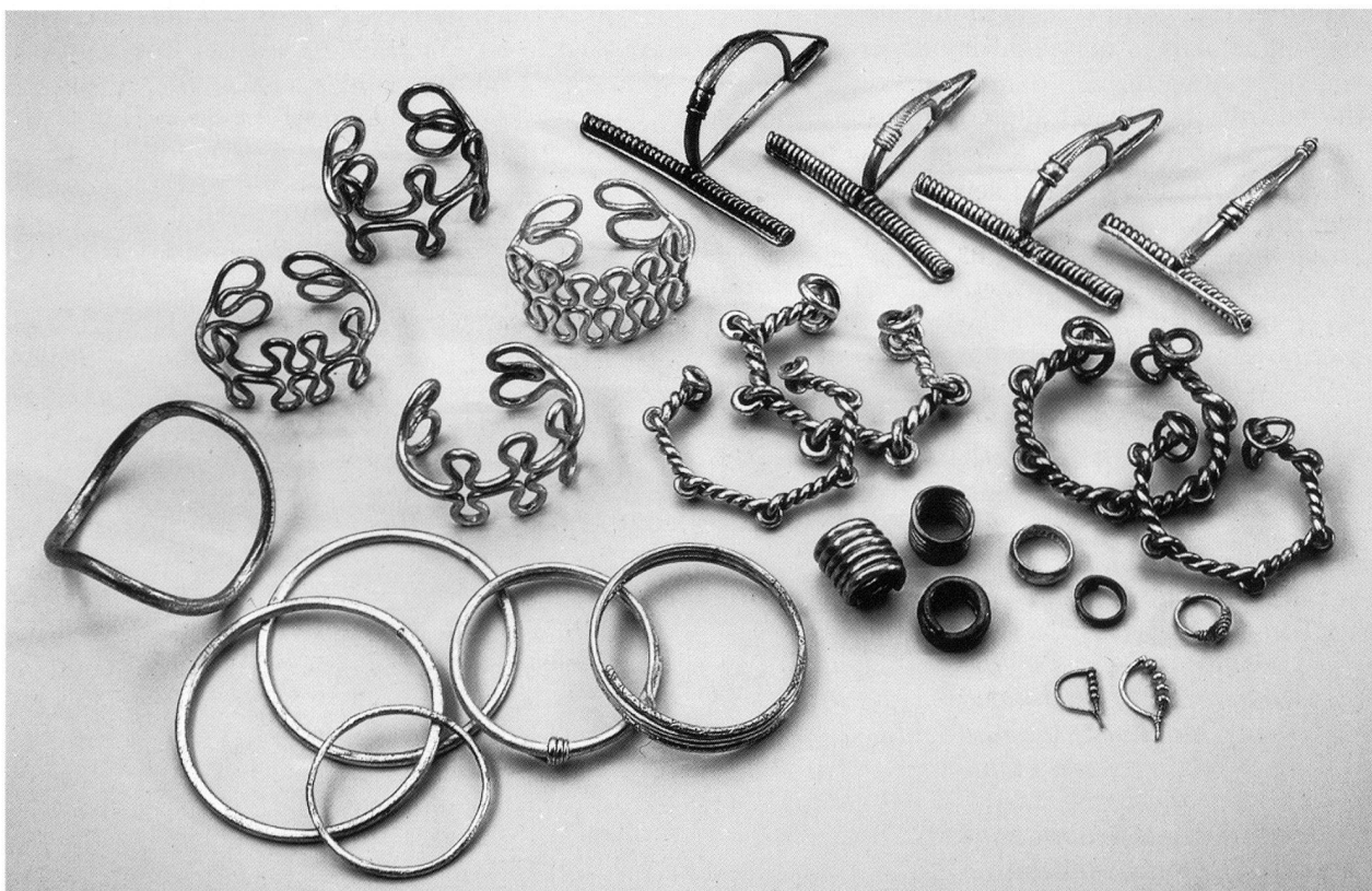
Fig. 3. Gioielli in argento da varie tombe di Giubiasco; II-I secolo a. C..