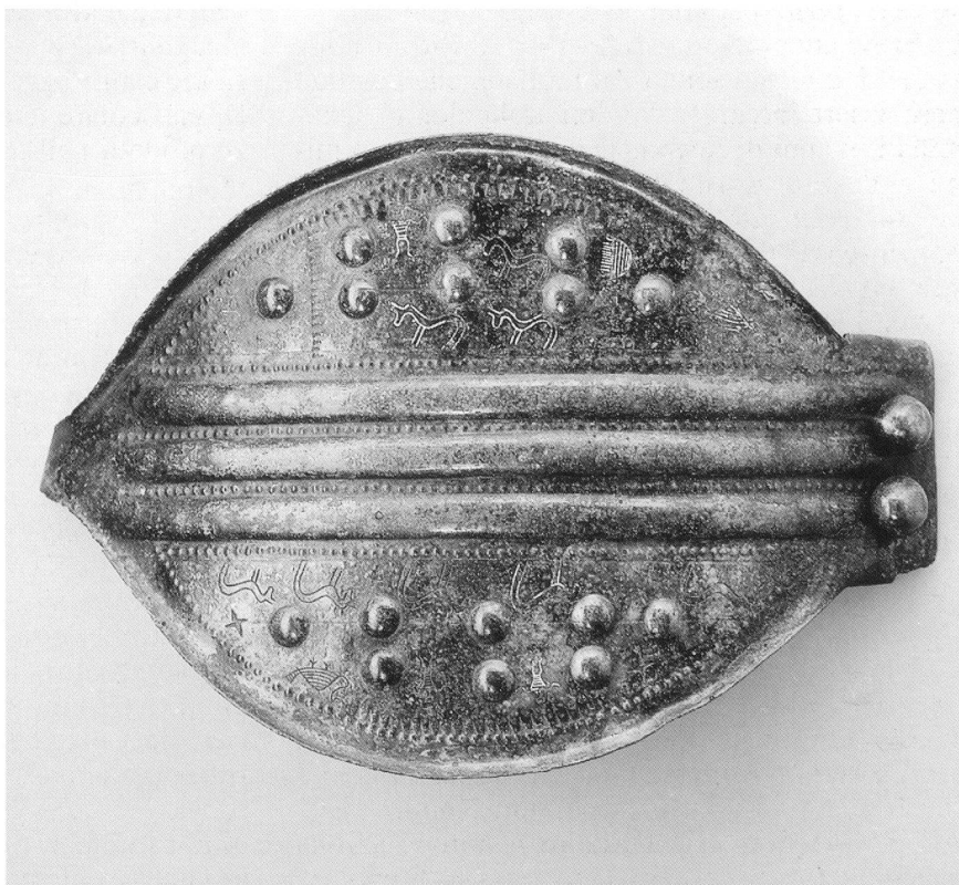
Fig. 1. Gancio da cintura femminile in bronzo da Arbedo-Cerinasca; V secolo a. C. (foto Museo Nazionale Svizzero, Zurigo).

I Leponti furono anche dei guerrieri, come testimoniano le numerose armi rinvenute per la maggior parte nella necropoli di Giubiasco, vicino a Bellinzona: spade e foderi, elmi, punte di lancia e asce da combattimento, ispirate all'equipaggiamento di altre popolazioni, in parte utilizzando elementi importati, in parte producendone imita-