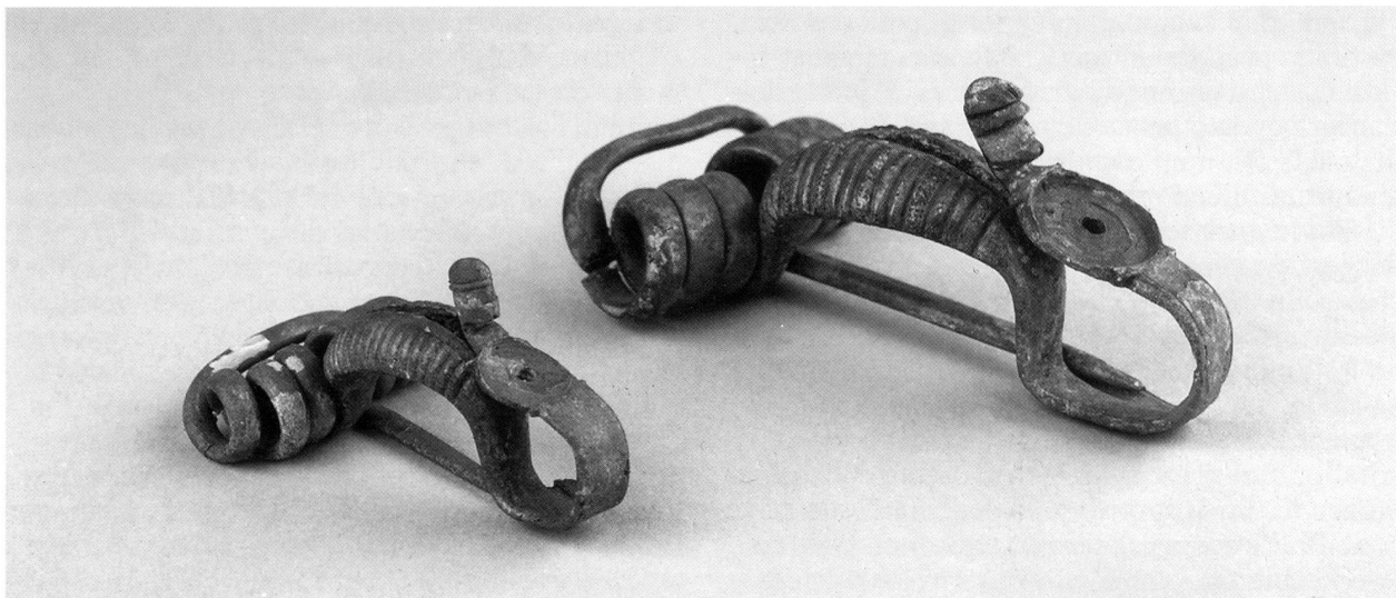
Fig. 2. Fibule decorate da una testa con elmo e da un disco per l'alloggiamento del corallo da Gudo (III-II secolo a. C.).