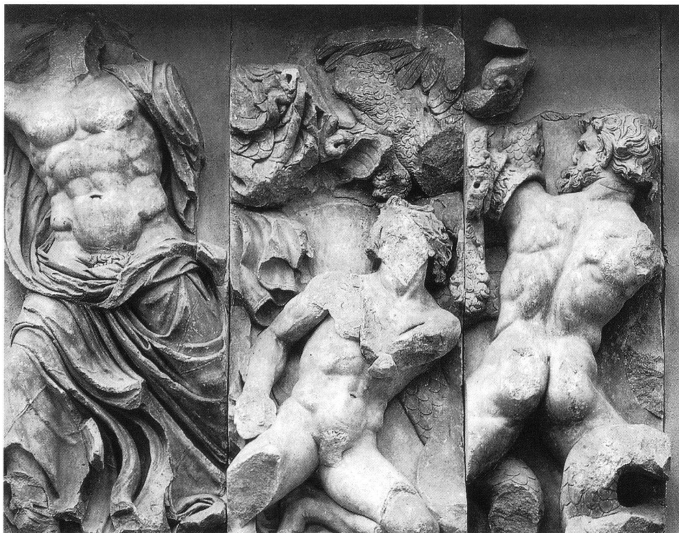
5. Fregio con Gigantomachia, particolare con Zeus in lotta con il gigante Porfirione. Catalogo Antikenmuseum, Berlino 1998, no. 35.

La battaglia di Bibracte (oggi Mont Beuvray fra Nièvre e Autun) ebbe, come sappiamo, un esito disastroso per gli Elvezi e i loro alleati. Delle 368.000 persone che secondo Cesare ( Bellum Gallicum I, 29) erano partite dall'altipiano svizzero ne ritornarono in patria non più di 110.000. A ciò si deve probabilmente lo spopolamento, sensibile ancora per generazioni, del territorio elvetico orientale, quello che si estende dalla confluenza di Aare e Reuss con il Reno fino al lago di Costanza. Il fatto nuovo per Roma era che il confine nord dell'Impero non erano ormai più le Alpi ma il Reno: confine che, per proteggere l'Italia, andava difeso. La difesa a lungo termine poteva però risultare effettiva solo se alle misure militari se ne accompagnavano altre che agissero a livello più