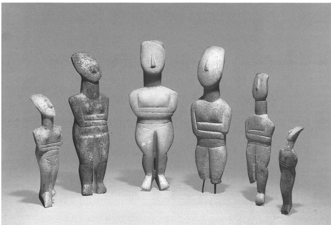
Civiltà cicladica. II periodo ca. 2800/2300 a. C., figure femminili in marmo

geo settentrionale, l'Asia Minore, Cipro e il Vicino Oriente. Erano quindi non solo importanti scali sulle rotte commerciali di tutta l'Antichità, ma anche un punto di incontri e scambi. Alcune isole, come ad esempio Naxos, hanno sempre avuto un ruolo di rilievo, altre invece emergono solo durante un determinato periodo. Nell'Età del Bronzo, e precisamente nel corso del III millennio a.C., si sviluppa su queste isole, grazie anche ad impulsi giunti dall'esterno e cioè soprattutto dalle coste dell'Anatolia, la civiltà chiamata appunto cicladica, la cui testimonianza più particolare e meglio nota sono le famose statuette di marmo. Determinante per la fioritura di questa civiltà sono però anche le ricchezze del sottosuolo ampiamente sfruttate su più isole. Molto richiesta era sin dal primo Neolitico l'ossidiana dell'isola di Melos, utilizzata per molti secoli per fabbricare lame ed altri utensili. Accanto all'ossidiana sono importanti anche alcuni metalli preziosi (oro e argento) cui si aggiunge poi il marmo - soprattutto quello di Naxos e Pa-