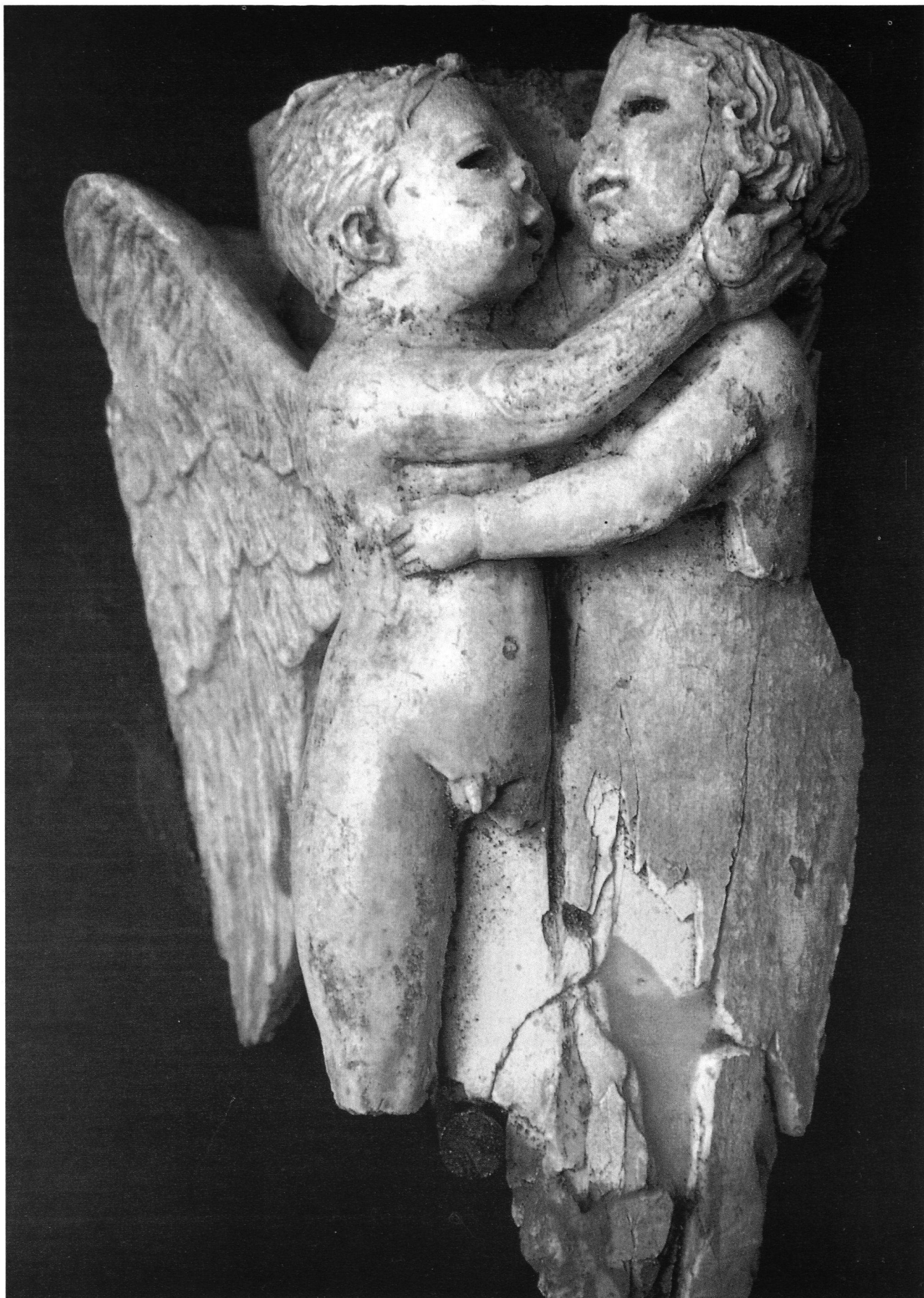
Elemento decorativo in avorio di un letto funerario da Aielli (l'Aquila), età augustea (fine I sec. a.C. / inizi I sec. d.C.) Trafugato nel dicembre 1982 dal Museo Nazionale Romano e recuperato nel maggio del 1983 dalla Guardia di Finanza