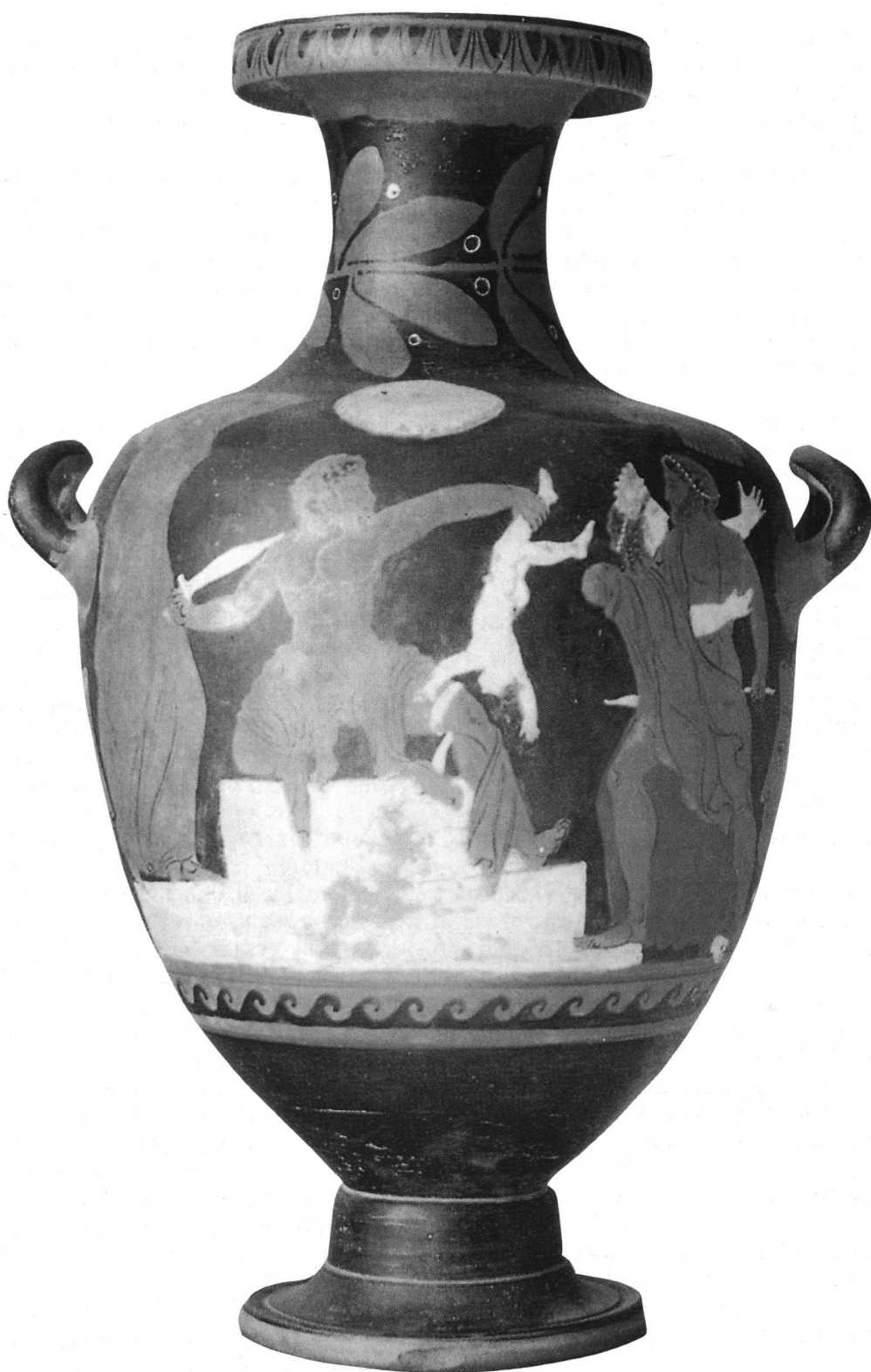
Vaso (hydria) italiota a figure rosse. Ultimo venticinquennio del IV sec. a.C. Napoli, Museo Archeologico Nazionale. Il vaso, rubato nel 1991 dal Museo, è stato recuperato a Benevento dalla Polizia di Stato nello stesso anno.