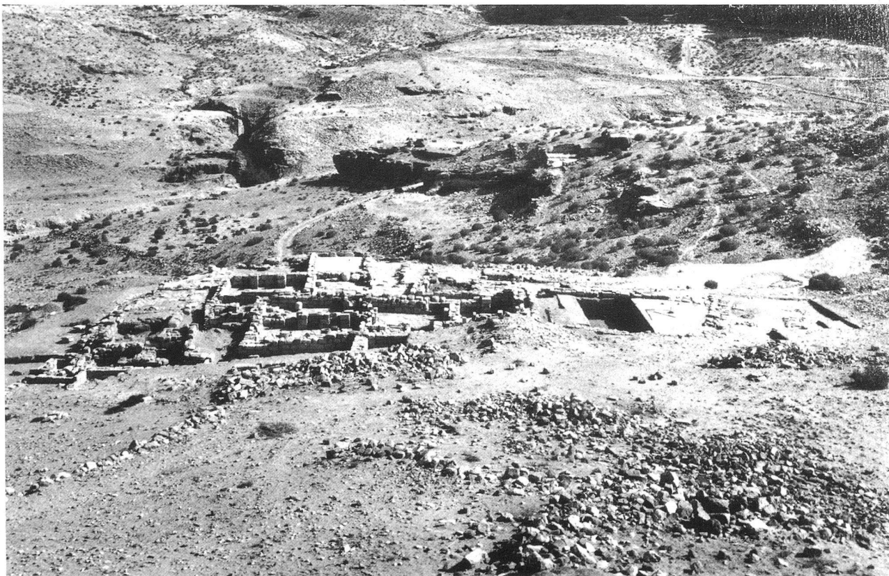
Casa nabatea venuta alla luce sul terrazzo superiore

Lo scavo sul secondo terrazzo di Ez Zantur, situato leggermente più in basso del precedente, ha addirittura portato alla luce, all’interno di un’altra costruzione nabatea, un complicato sistema di cisterne e canali profondamente scavati nella roccia. Il complesso è da mettere in relazione con una stanza