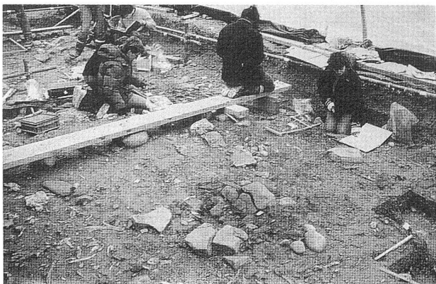
Gli scavi a Neuchâtel-Monruz. Livello che risale al periodo Cro-Magnon, circa 13'000 anni fa. In primo piano un focolare.

In trent'anni di pratica, il contributo del genio civile alla cultura ammonta circa al 3 o/oo dei crediti investiti sull'insieme della rete nazionale; ciò rappresenta quindi alcune decine di milioni di franchi consacrati all'esplorazione del passato. Misura opportuna: senza questa saggia decisione i primi cimiteri cristiani nel canton Friburgo, il teatro romano di Lenzburg, i "mazots" preistorici di Briga-Gils, i villaggi lacustri di Auvernier avrebbero potuto essere esplorati solo con i mezzi limitati dell'archeologia cantonale. In altri termini, sarebbero stati abbandonati a una distruzione quasi totale.