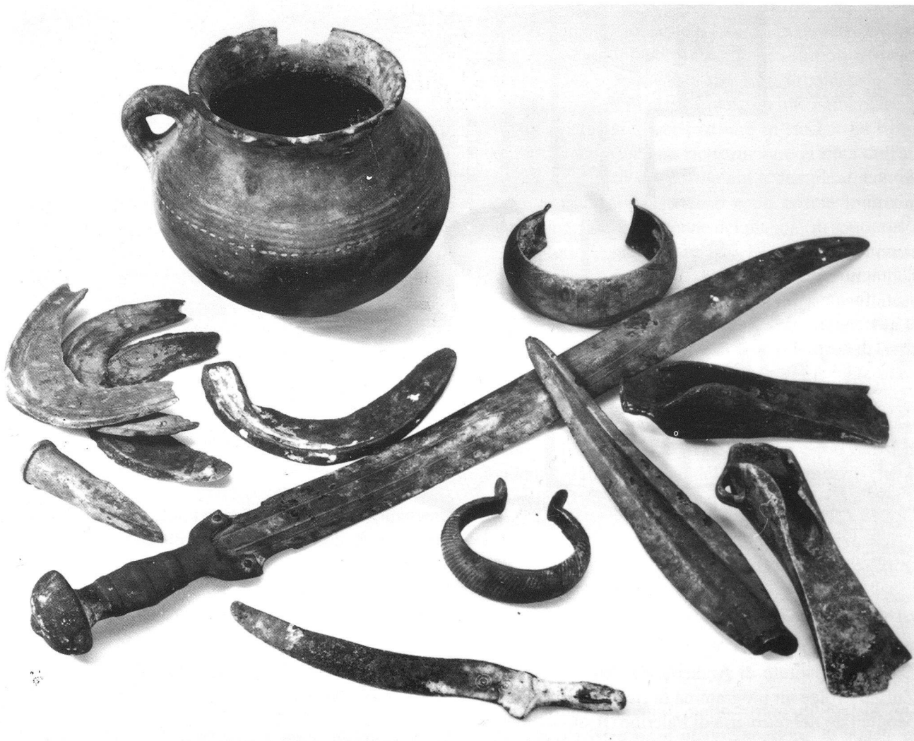
Materiali diversi scoperti a Auvèrnier, assegnabili al bronzo finale (VIII sec. a.C.: vasellame, armi, attrezzi e parures in bronzo)