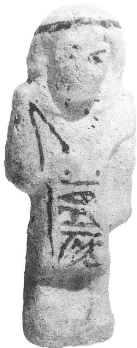
Figurina funeraria (capomastro) al nome di Nes-mout, Faïence. Terzo Periodo Intermedio XXI-XXII dinastia (collezione privata, Ginevra)