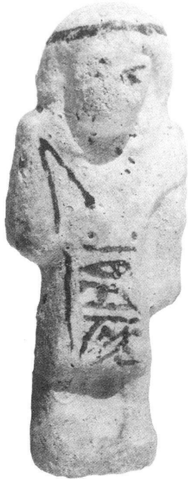
Figurina funeraria (capomastro) al nome di Nes-mout, Faïence. Terzo Periodo Intermedio XXI-XXII dinastia (collezione privata, Ginevra)