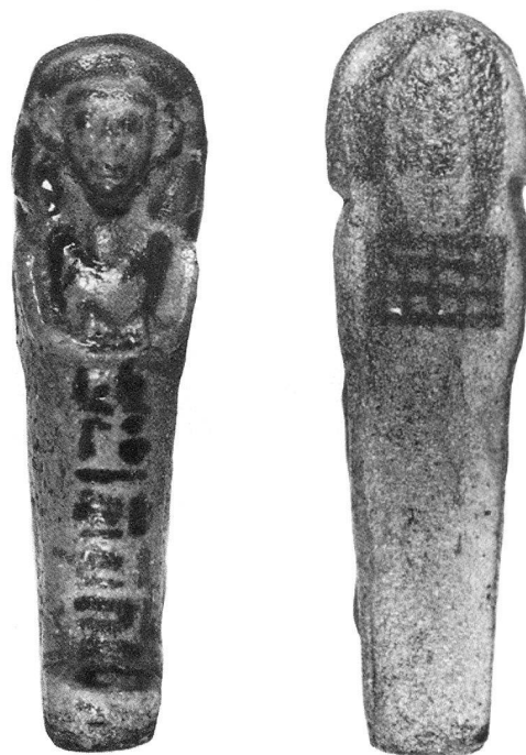
Figurina funeraria al nome di "padre divino d'Amon Amenemope" faïence, vista di fronte. Terzo Periodo Intermedio XXI dinastia, nelle mani della statuetta si vedono due attrezzi agricoli. (collezione privata, Ginevra) La stessa figurina vista dietro: sul dorso è dipinto un sacco per il trasporto della terra

Le figurine funerarie egiziane giocano un doppio ruolo: da una parte sono dei sostituti del defunto nel caso la mummia sparisce, e, d'altra parte, sono al servizio dello stesso per eseguire i compiti sgradevoli nell'al di là. Poiché se, nel suo insieme, l'al di là egizio è un luogo di quiete, non per questo è meno misterioso, ed è difficilmente percettibile dai viventi (da cui numerosi testi "magici", come i libri funerari, che tentano di definirlo, cioè di permettere agli egiziani di appropriarsene). Gli antichi egizi sembrano nutrire una viva inquietudine per quanto riguarda la loro sopravvivenza in questo luogo: cosa si mangerà, cosa si berrà? La risposta è in parte fornita dall'offerta funeraria che i discendenti indirizzano al loro defunto. Comunque, l'offerta non sfugge alle contingenze materiali ed umane: i monumenti più prestigiosi possono essere distrutti ed il servizio di culto scordato o interrotto. La magia offre una risposta a queste paure.