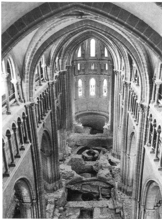
L'interno della cattedrale di Saint-Pierre durante gli scavi

Nel 443 i Burgundi occupano la Sapaudia e Ginevra diventa la prima capitale del regno. La città è protetta da possenti fortificazioni, e anche spalleggiata, sul piano militare, dall'agglomerazione di Carouge, dove è installata da parecchi secoli la sede di una guarnigione difesa da muri e fossati. E' sicuramente là che Sigismondo viene acclamato re dal suo esercito nel 516. Gli scavi condotti in questi ultimi anni dimostrano come il porto ed il quartiere circostante non abbiano perso importanza. Lungo tutta la riva sinistra della rada, infatti, fino al ponte sul Rodano, vi sono testimonianze di un'attività commerciale fiorente.