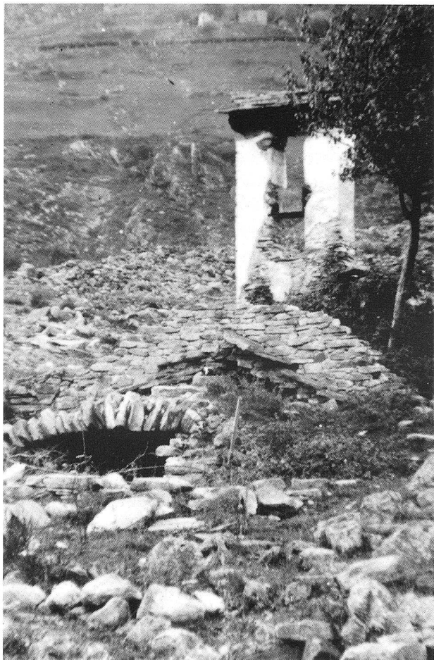
Oratorio della Natività