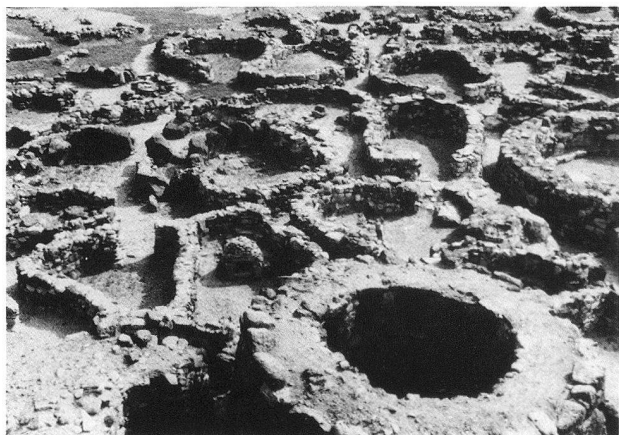
Su Nuraxi, Barùmini: resti del villaggio nuragico

Ha concluso il viaggio nel paesaggio archeologico sardo, la puntata al tempio di Antas, nell'Iglesiente, significativo luogo d'incontro della cultura fenicio-punica con quella romana del III sec. d. C.