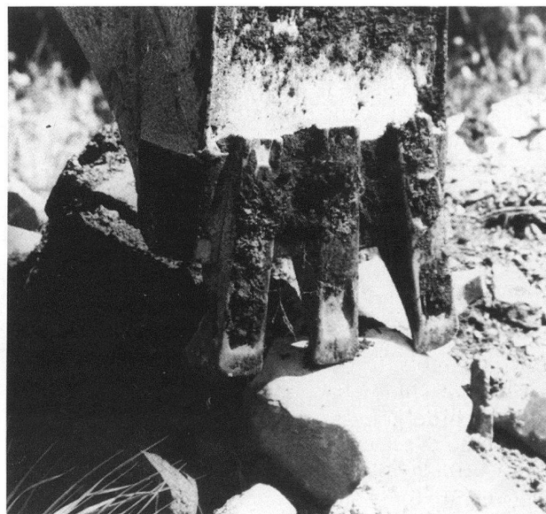
Molto sovente il lavoro dell'archeologo si svolge sotto l'incalzare delle ruspe.

Se prima il problema sembrava circoscritto agli insediamenti urbani, la fuga dalle città di questi ultimi anni ha spostato il problema anche alla campagna,