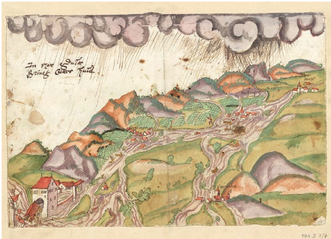
In Not Gedult Bringt Gottes Huld: Illustration zum Bericht über das Unwetter vom 29. August 1568 (7. Band der Wickiana), bei dem die Bäche das Wettinger Feld überschwemmt, links unten das Landvogteischloss. Bild: ZB Zürich, Graphische Sammlung und Fotoarchiv, PAS II. 7/7.