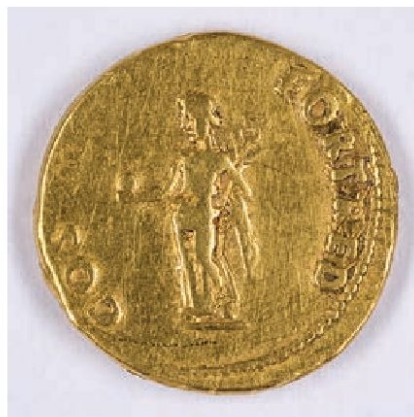
Die Münze zu Ehren Walter Niggelers zu dessen 80. Geburtstag. Massstab 1:1.