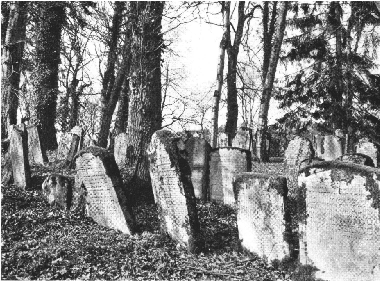
Der Judenfriedhof zwischen Endingen und Lengnau