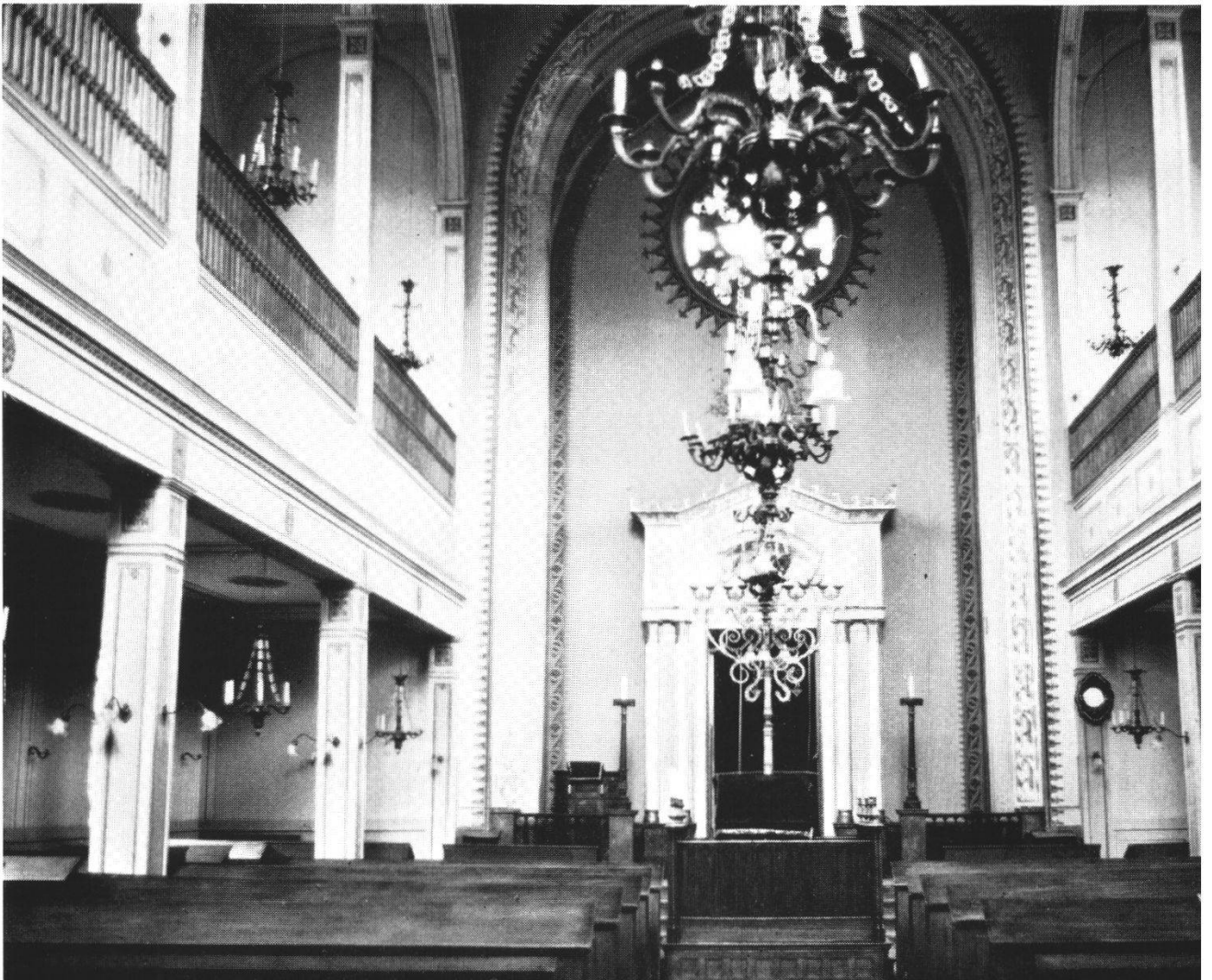
Innenansicht der Synagoge in Lengnau