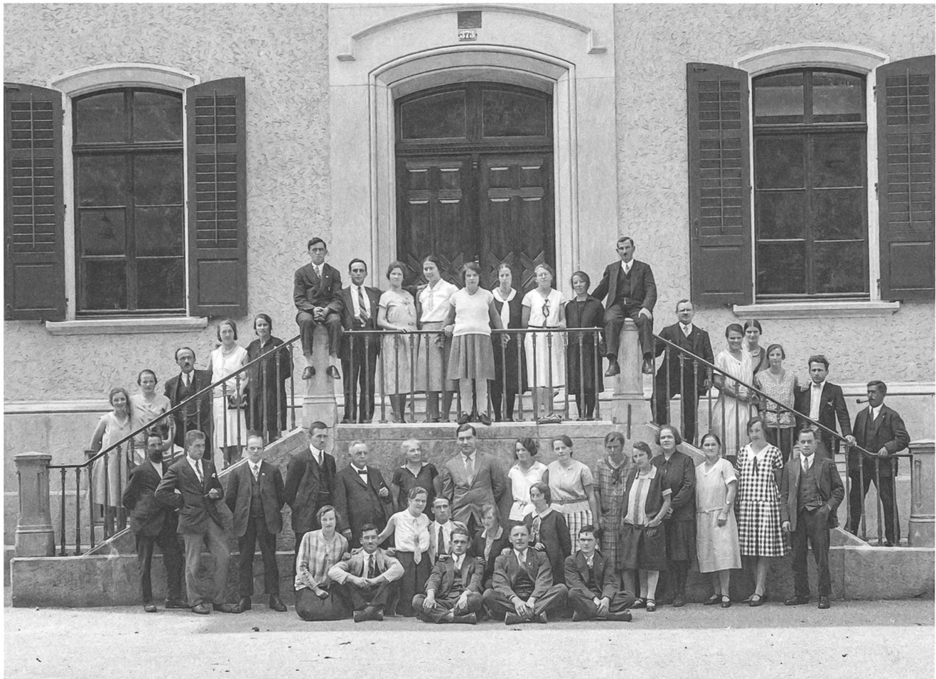
Teilnehmende des Samariterkurses vor dem alten Schulhaus Baden, 1930.