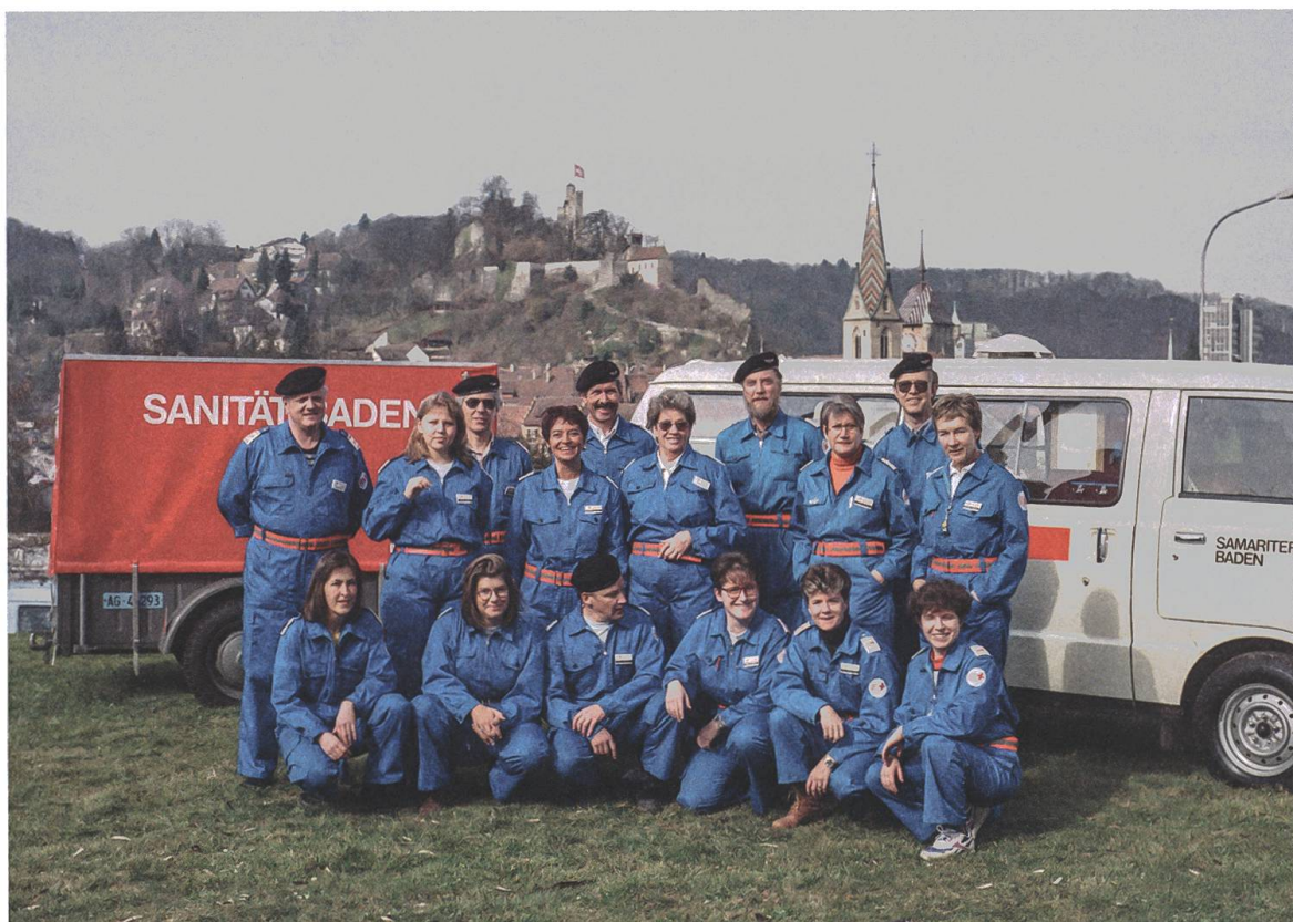
Alarmgruppe des SVB, 1997.