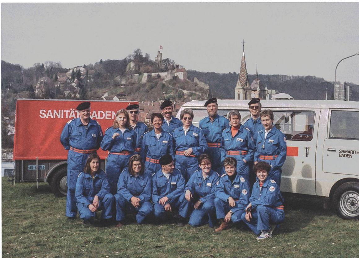
Alarmgruppe des SVB, 1997.