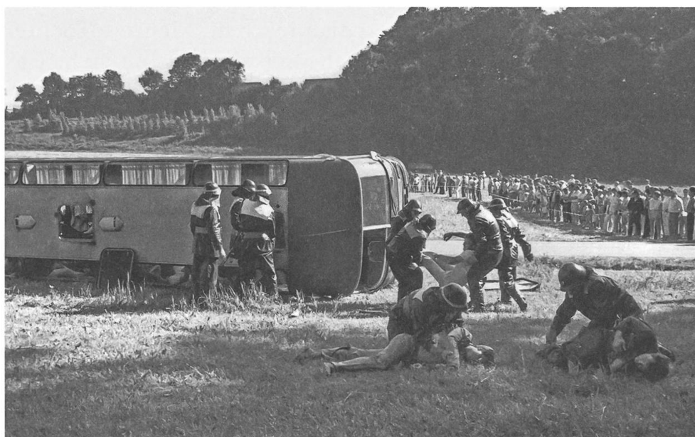
Katastrophenübung des SVB in Mellingen im Juni 1986.