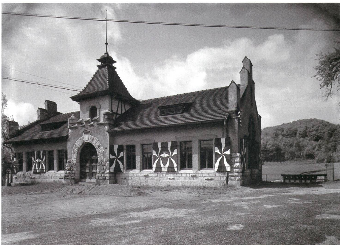
Die Urkunde von 1465 über die Gründung der Sebastiansbruderschaft.