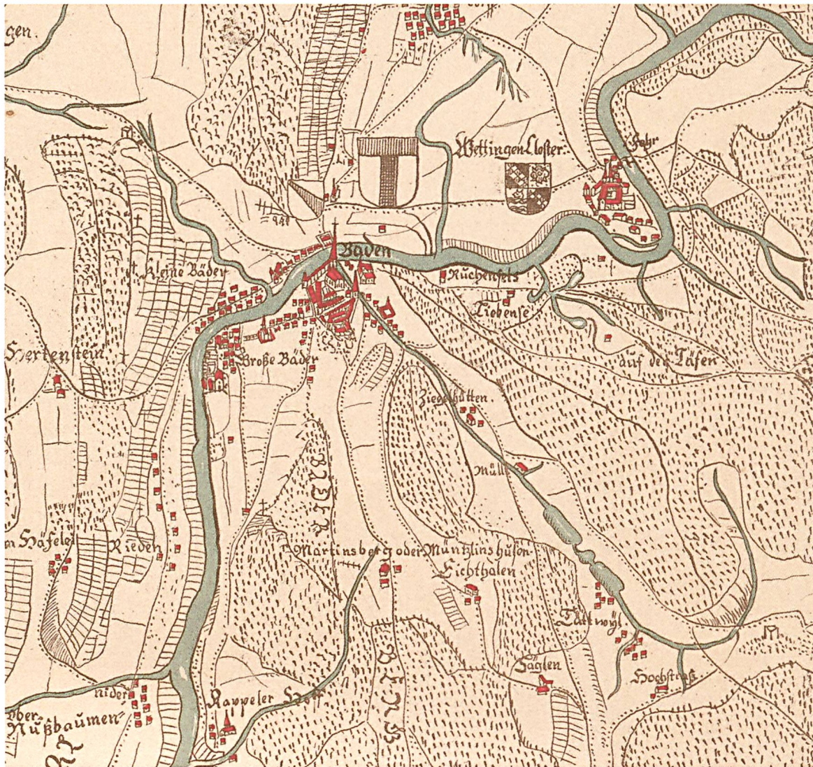
Der Pilgerweg zwischen Kloster Wettingen (oben) und Galgen (rechts) südlich von Dättwil. «Uff der Täferi» steht auf der Limmattaler Seite (siehe Text). Im Tälchen der Täfer-Matt ist der Täfer-Hof nicht sichtbar. Bild: vgl. Anm. 18.