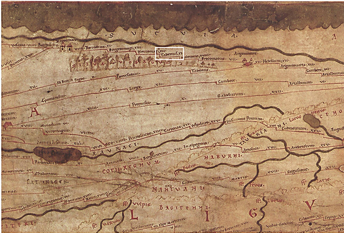
Das Keramik- und das Truppenzentrum sind auf der Tabula Peutingeriana, einer spätrömischen Strassenkarte, verzeichnet (4. Jh., Abschrift Staatsbibliothek Österreich in Wien vom 13. Jh.): Westlich des Rheins, gegenüber von SVEVIA (Land der Sueben), steht «Tabernis XI», also «11 Meilen ab Tabernae (Rhein Zabern)». Schräg rechts darunter «Tabernis» «ab Zabern/Saverne ...» ohne Angabe der Distanz nach Argentoratum/Strassburg. Bild: Wikimedia Commons, Segmentum II.