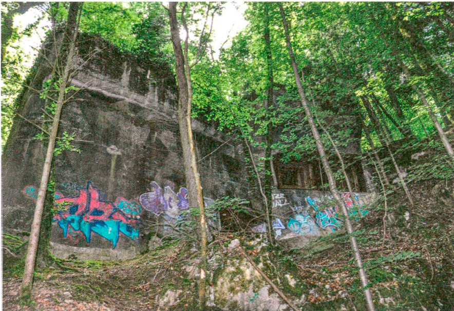
Baden A 4068 Flueholz