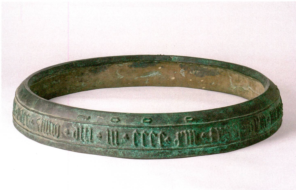
Bronzeabguss des Schlagrings der Mittagsglocke, die 1413 von Johannes Reber in Aarau für die Stadtkirche Maria Himmelfahrt Baden gegossen wurde. Es handelt sich um eine Kopie des Originals, das bei Rüetschi AG, Aarau, als ältestes Zeugnis der Aarauer Glockengussstradition aufbewahrt wird. Historisches Museum Baden.