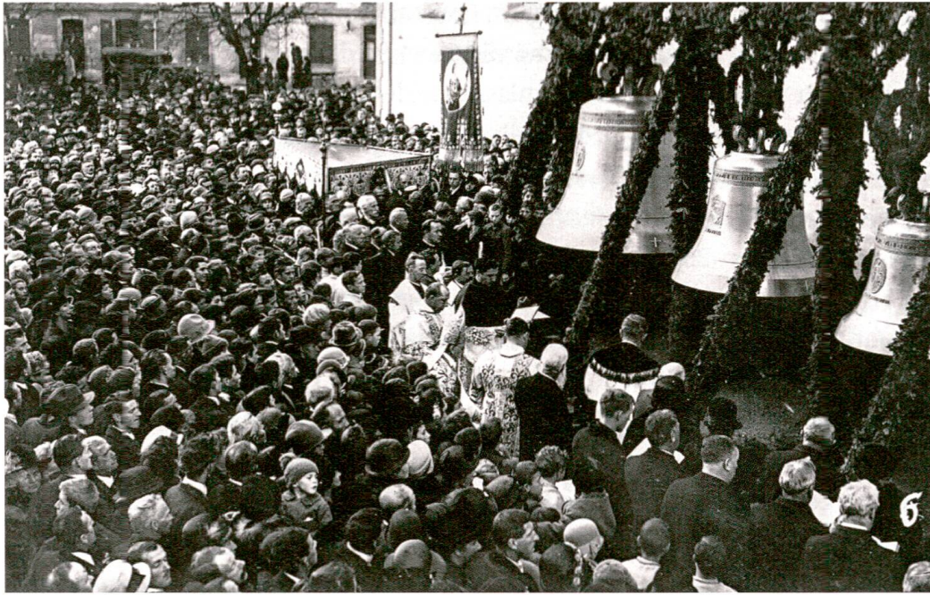
Stadtkirche Baden, 28. November 1926, Bischof Josephus Ambühl weiht das neue Geläut. Am darauffolgenden 1. November werden die Glocken von den Schulkindern in den «Chrälleturm» hochgezogen.