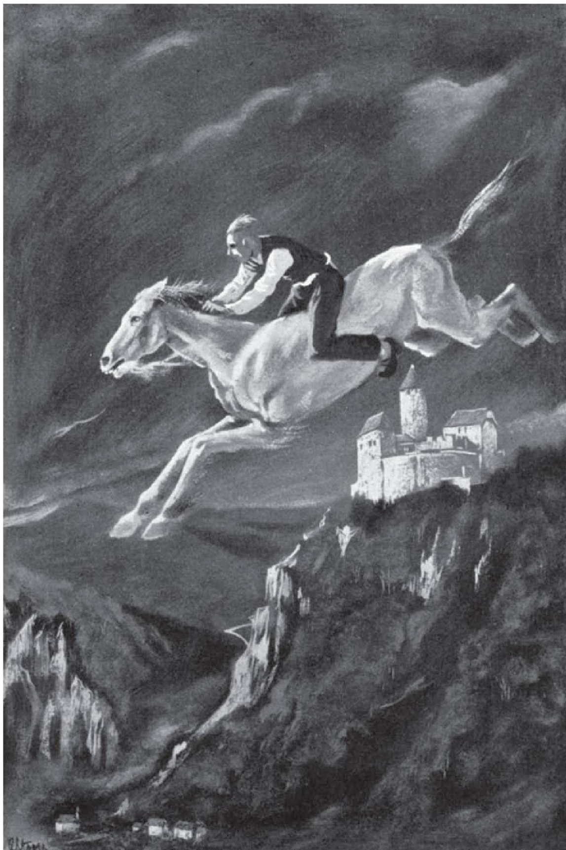
Abb. 1: Ein Schimmel fliegt von St. Gallen nach Baden. Aquarell von Robert Stoop, Zürich. Original Verschollen. Abb. aus Tilgenkamp, «Schweizer Luftfahrt», Band I, 17.