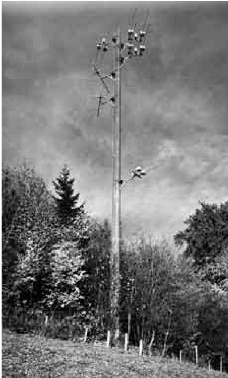
«Rüsler»-Gemeinschaftsantenne 2 für alle Programme ab den Senderstandorten Bergalingen, Üetliberg, Stuttgart und Blauen. Eine dritte Gemeinschaftsantenne steht auf der Westseite der Heitersbergkuppe für alle Programme ab dem Sender- standort Mulhouse.