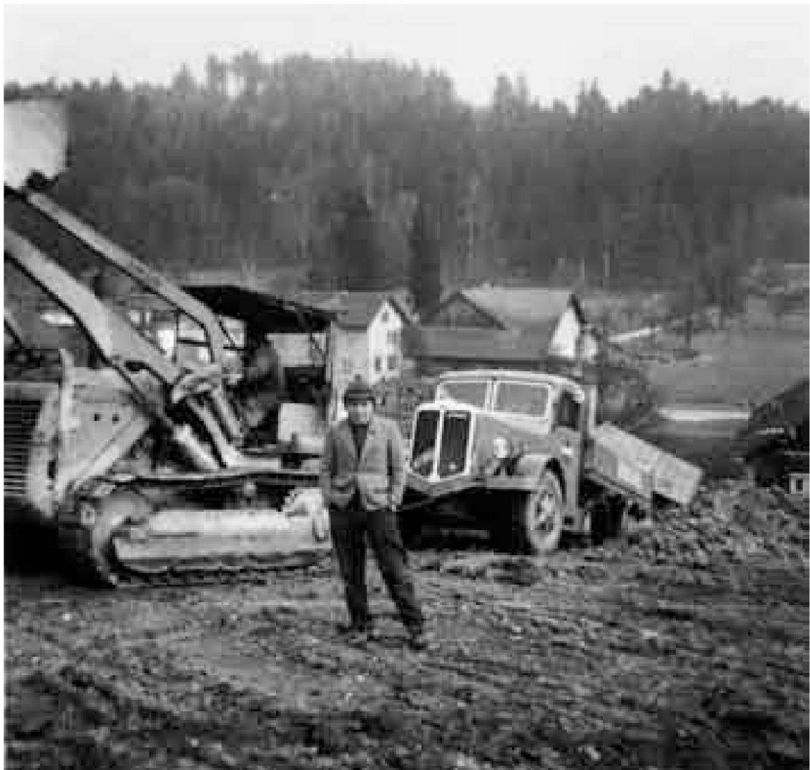
Teilweise Wiederauffüllung der Kiesgrube Galgenbuck, 1958. Hinter dem Trax das Restaurant Täfern, hinter dem Lastwagen der ehemalige Galgenstandort; das Terrain bleibt verändert.