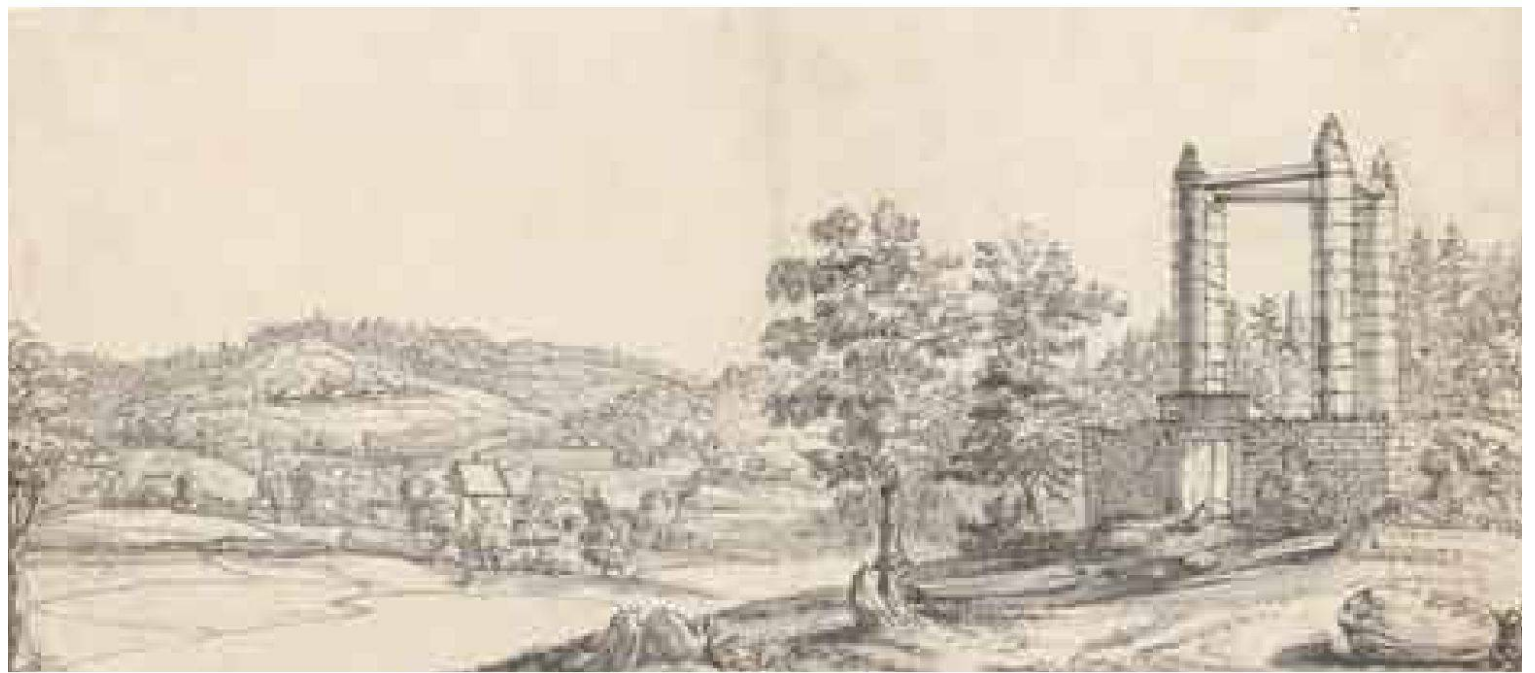
Blick vom dreischenkligen Galgen gegen Nordwesten auf das Dorf Dättwil, den Segelhof (links hinten) und den Unterhof (links vom Baum). Landschaft und Galgen sind, wie in allen erhaltenen Darstellungen, idealisiert. Getuschte Federzeichnung von Felix Meyer, 1675 (Zentralbibliothek Zürich, Graphische Sammlung, STF Felix Meyer XVIII 69).