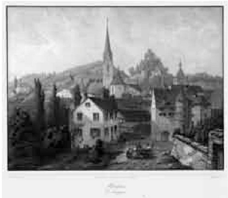
Blick von St. Anna um 1845, Stahlstich von J. Ulrich. Im Vorder- grund das neue Haus von Othmar Suter (Historisches Museum Baden, Grafische Sammlung, 8918).