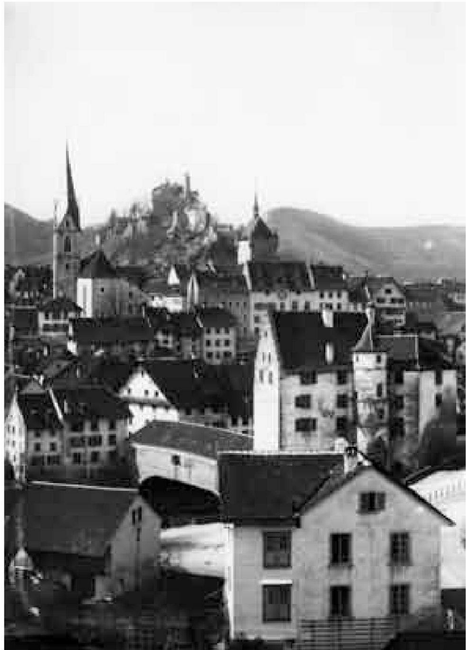
Blick von St. Anna um 1900. Wohnhaus und Scheune des Stohlergutes vor der Altstadt Baden.