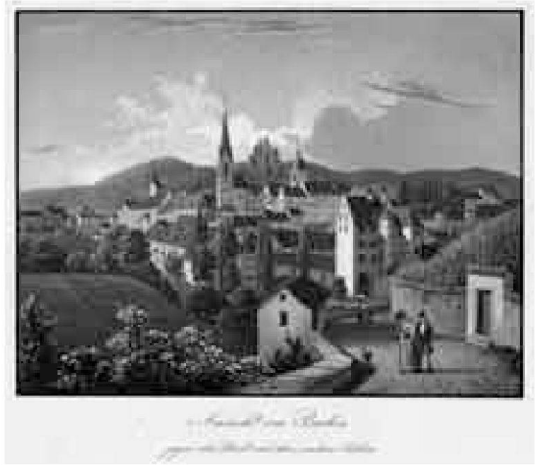
Blick von St. Anna um 1838, Aquatinta von Jakob Mayer- Attenhofer. Im Vordergrund das Gartenhaus von Gemeinderat Dominik Bürli (Historisches Museum Baden, Grafische Sammlung, 8683).