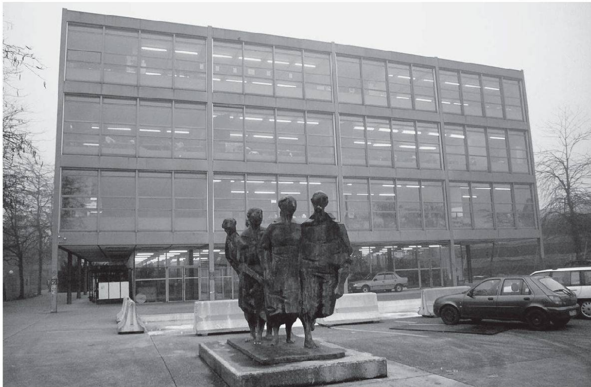
Hallers Hauptbau kurz vor der Sanierung.