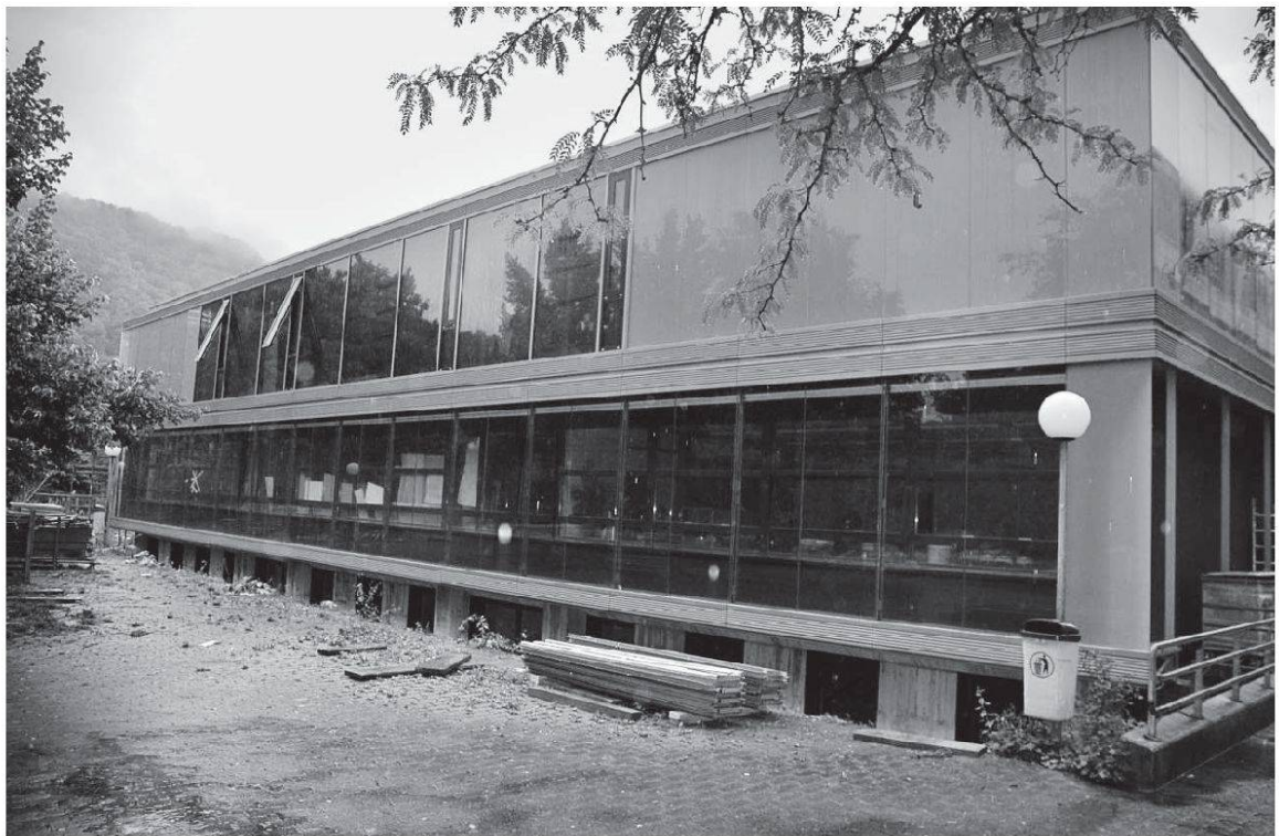
Der Trakt Naturwissenschaften kurz vor der Vollendung.