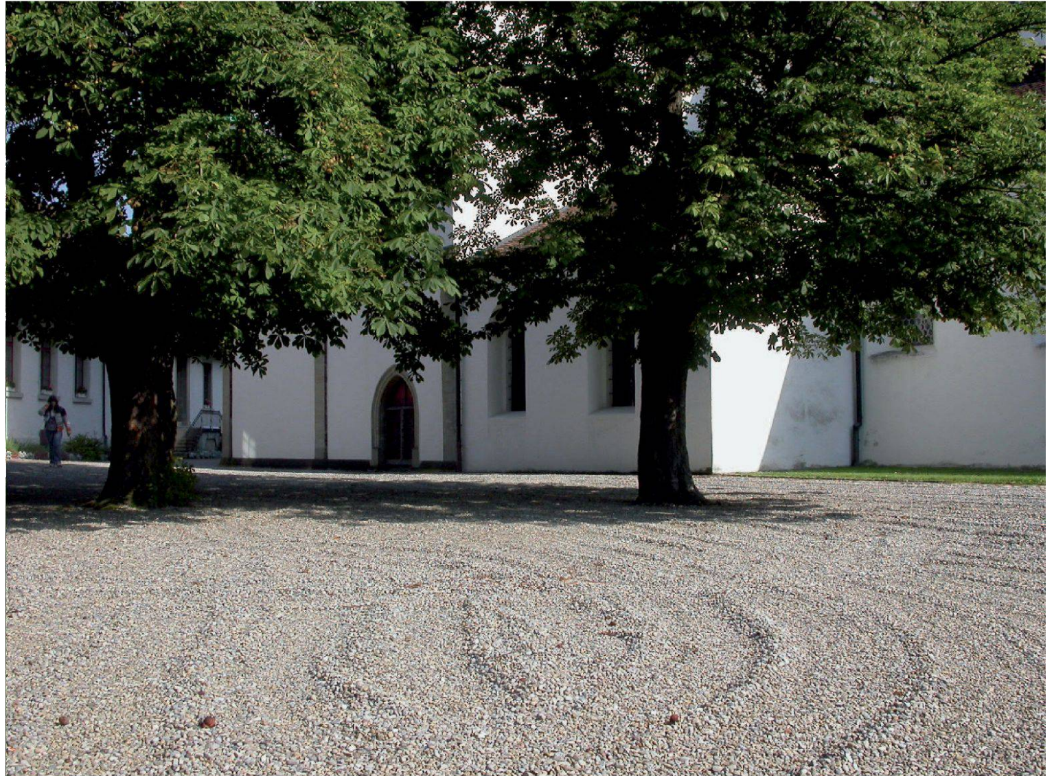
Kloster Wettingen. Areal des ehemaligen Konversen- und Laienfriedhofs. Im Hintergrund die Totenpforte der Klosterkirche (Peter Paul Stöckli).