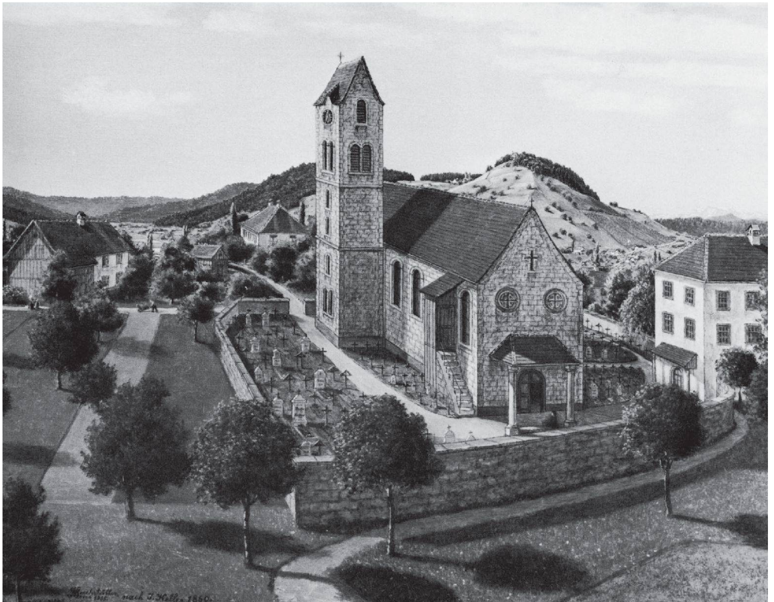
Der alte Kirchhof von Wettingen mit der alten, abgebrochenen Sebastianskirche und dem Friedhof. Rechts das heute noch bestehende, alte Dorfschulhaus. Die Kirchhofmauer im Vordergrund ist erhalten geblieben und vom Lindenplatz aus sichtbar. Vedute von Hans Buchstätter (1935) nach einem Gemälde von J. Keller von 1860. Aus: Eugen Meier, Walter Scherer: Wettingen früher. Baden 1981.