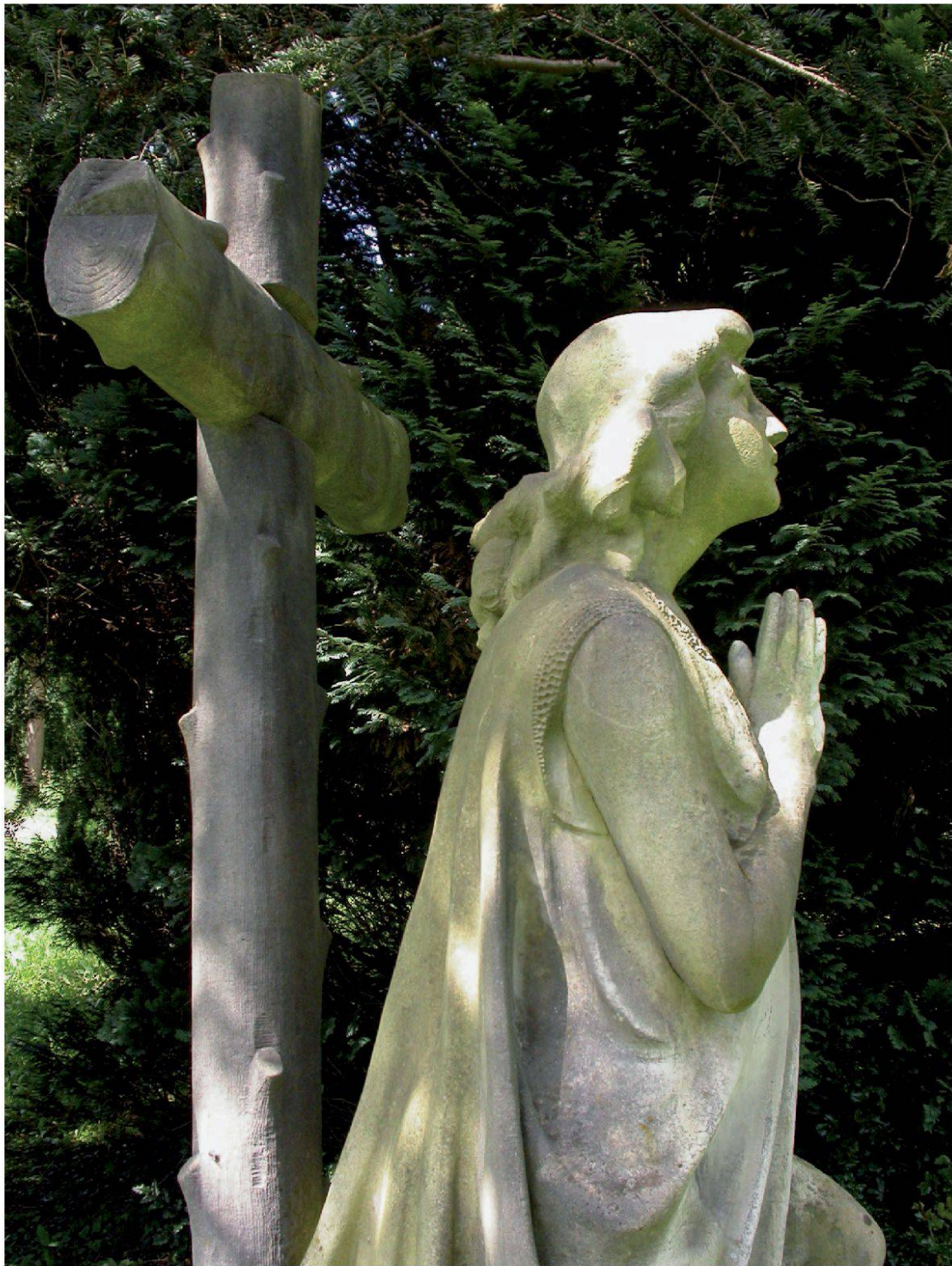
Friedhof Bruggerstrasse, Baden. Grabmalplastik von Bildhauer A. Fugazza, Baden (Peter Paul Stöckli).