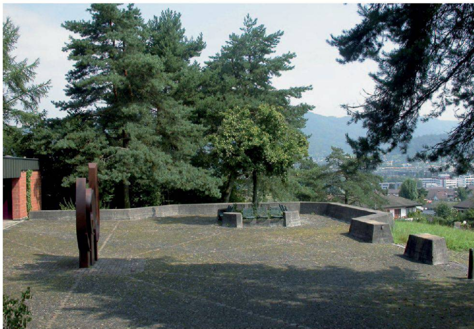
Alter Friedhof, Neuenhof. Eingangstor Seite Zürcherstrasse und Hapterschliessungsweg (Peter Paul Stöckli).