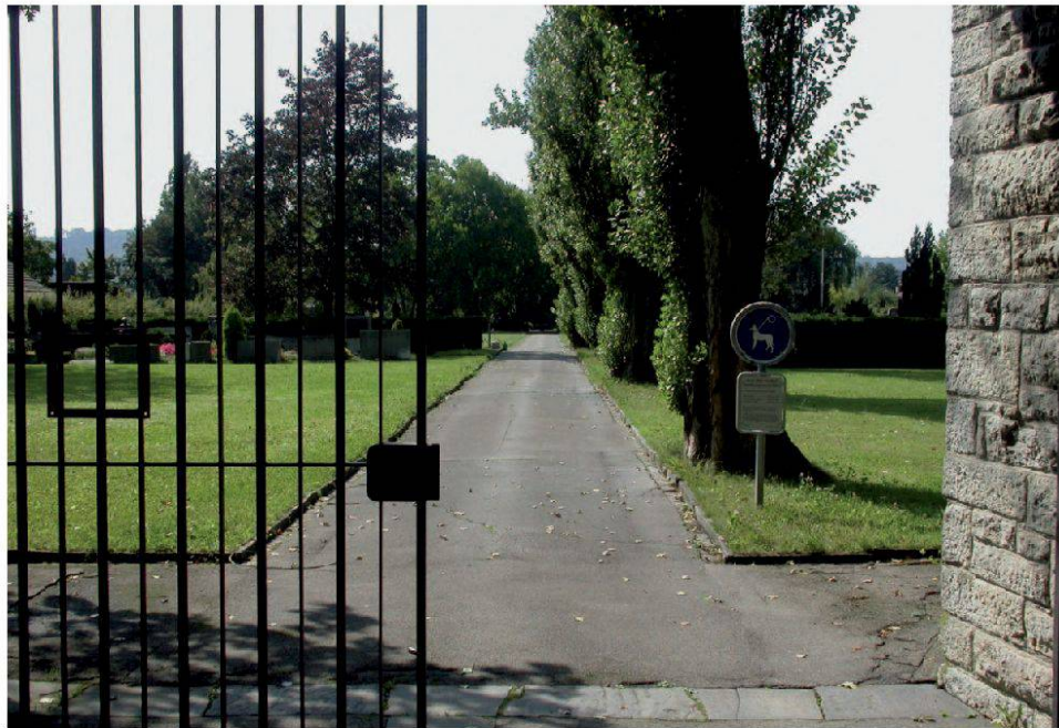
Friedhof Ennetbaden. Friedhofsgebäude in erhöhter Lage und neue Gemeinschaftsgrabanlage im Vordergrund (Peter Paul Stöckli).