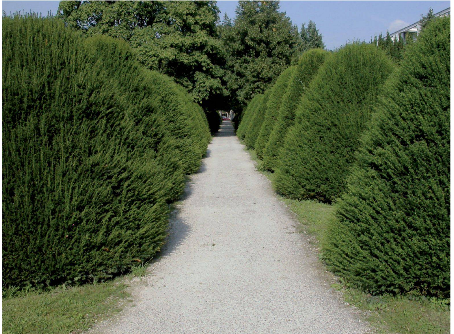
Friedhof Bruggerstrasse, Baden. Zentraler Erschliessungsweg mit geformten Eibenkegeln (Peter Paul Stöckli).