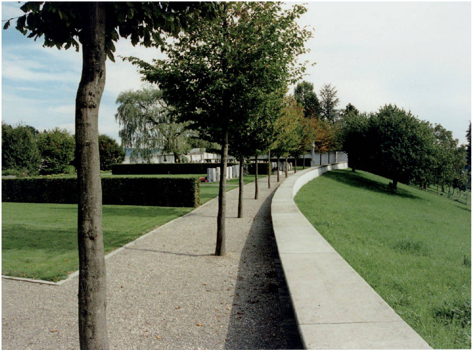
Friedhof Münzlishausen, Baden. Ein alter Feldweg ab Friedhofs- zugang. Im Hintergrund das Friedhofstor und die einfriedende Hecke (Peter Paul Stöckli).