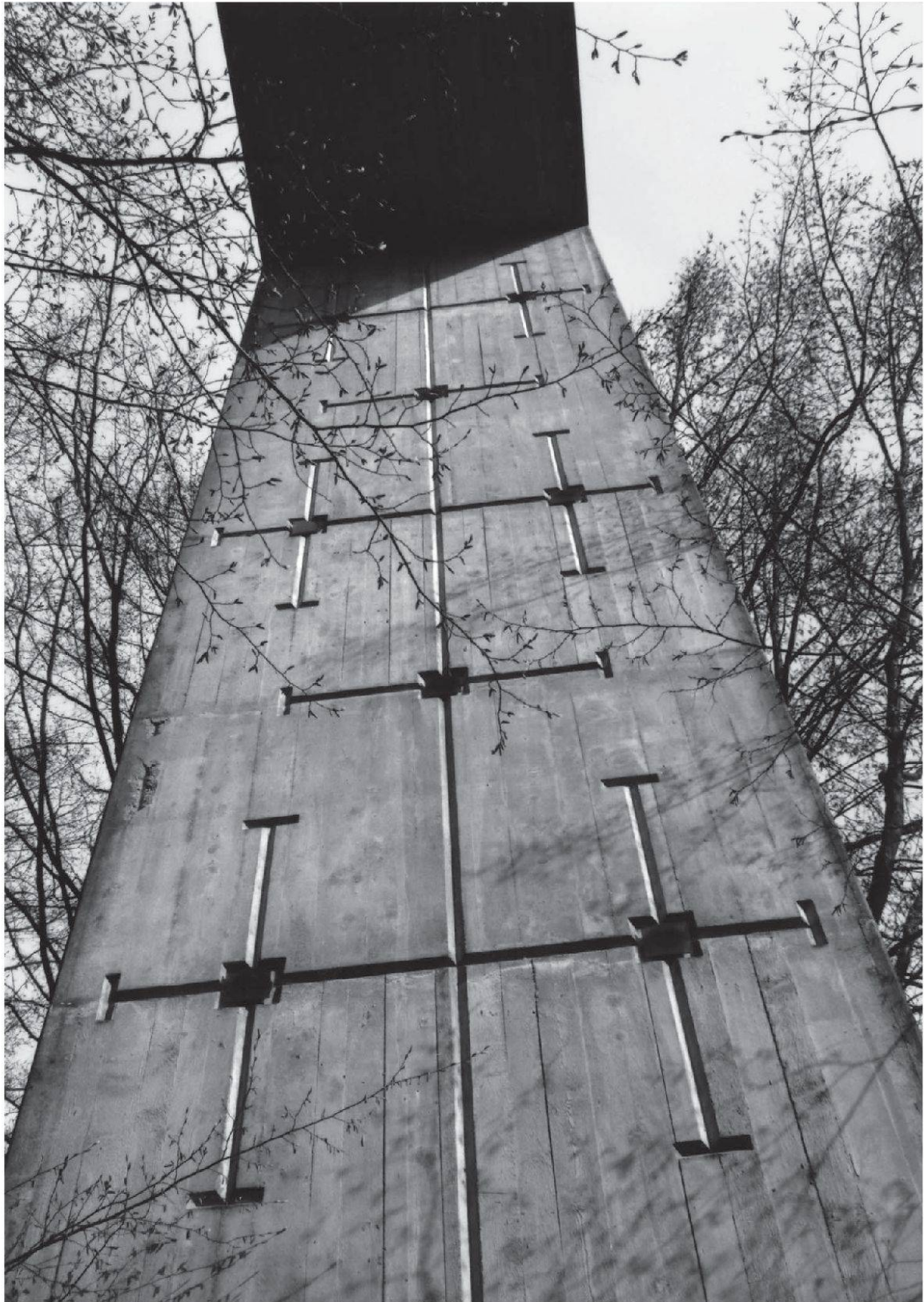
Friedhof Liebenfels, Baden. Das grosse Friedhofstor (Peter Paul Stöckli).