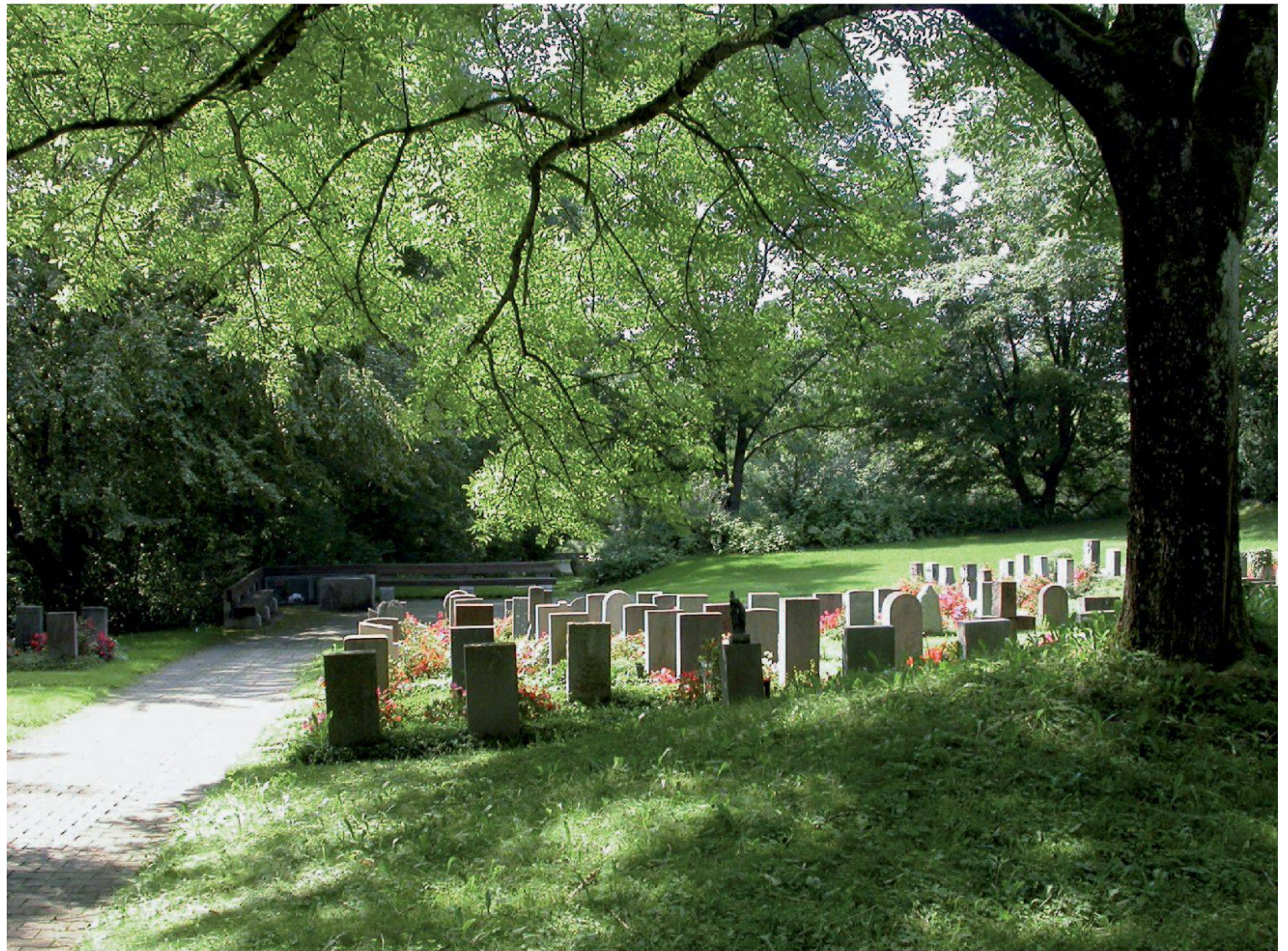
Friedhof Brunnenwiese, Wettingen. Grabfeld mit Solitärbaum in gekammertem Parkraum (Peter Paul Stöckli).