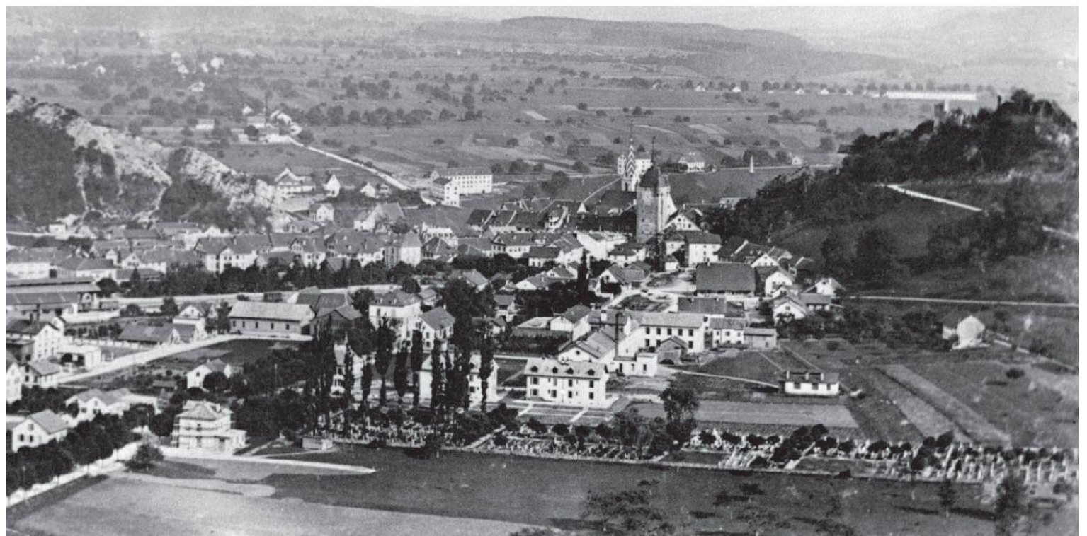
Friedhof Bruggerstrasse, Baden. Ausbauzustand 1893. Aus: Walter Scherer, Edi Zander: Badener Album. Baden 1976 (Fotograf: Henry Rieckel).