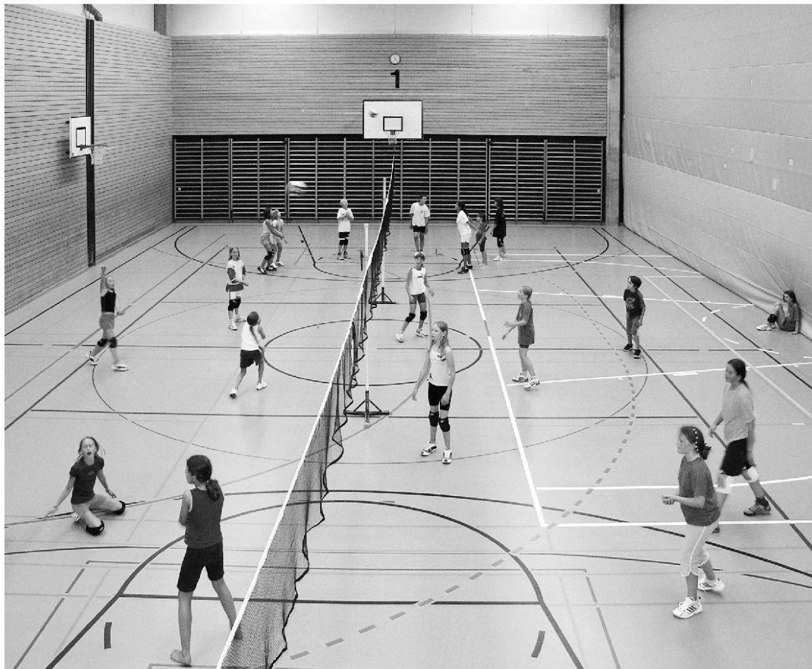
Arbeit mit dem Mini-Team heute.