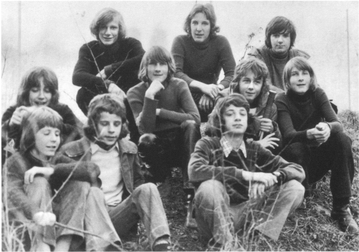
Neue Freiheiten, lange Haare: Badener Jungwachtgruppe 1973.