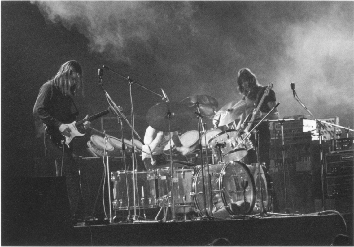
Der Soundtrack zum Jahrzehnt: Pink Floyd im Zürcher Hallenstadion, 1972.