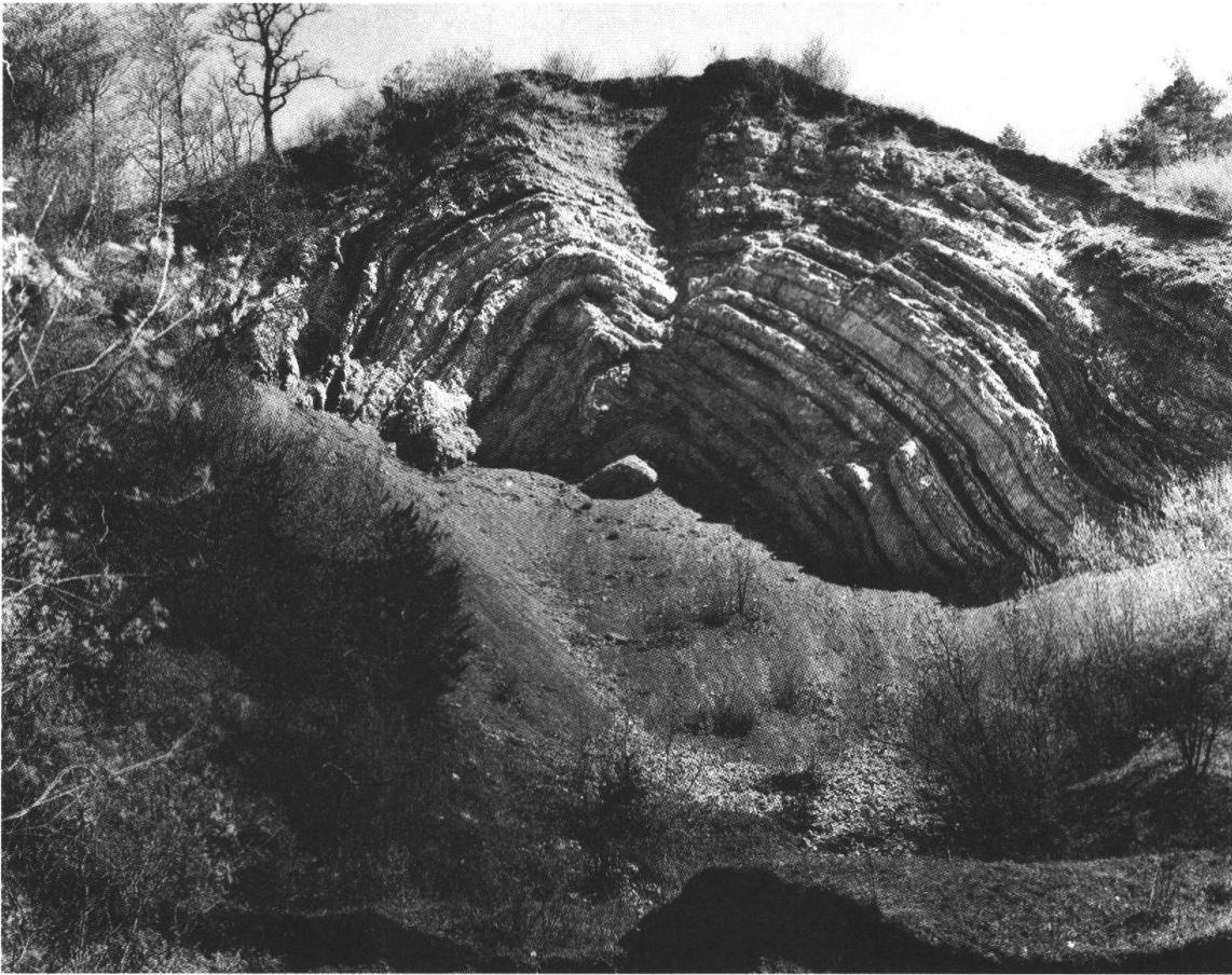
Gipsgrube mit «versteinertem Regenbogen» um 1960.