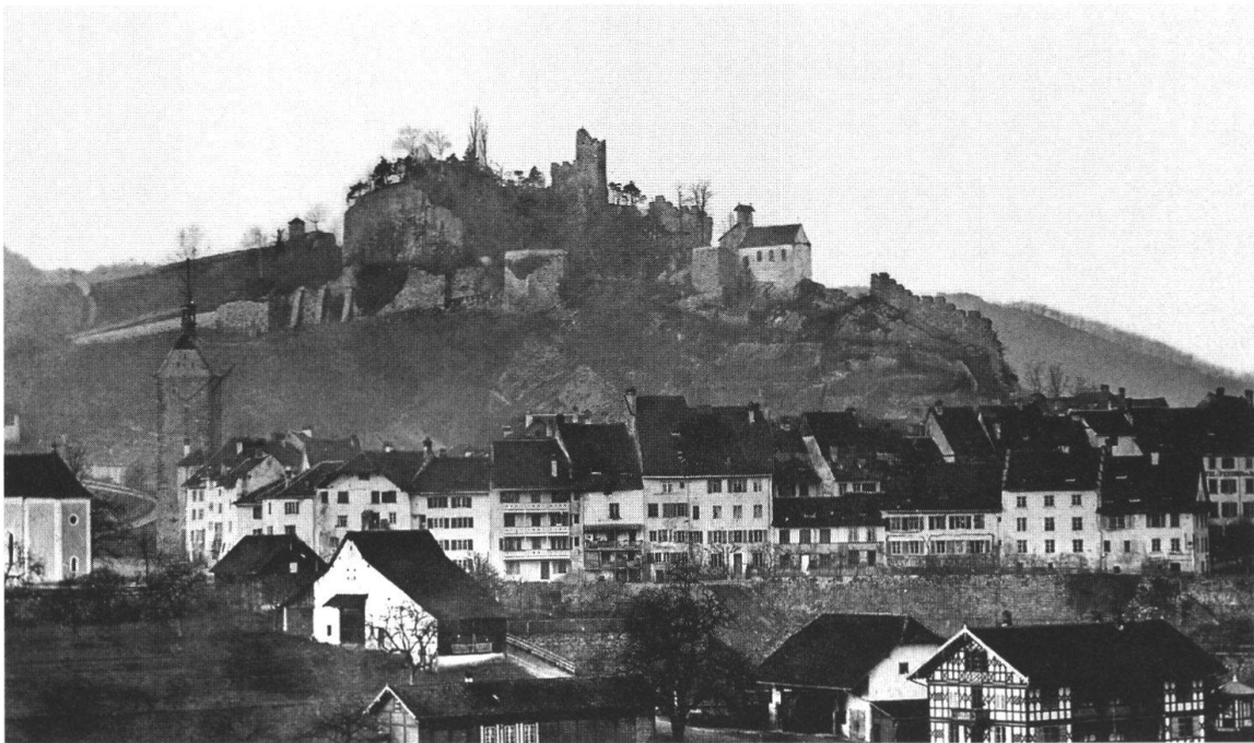
Ruine Stein um 1873, flankiert von der St. Niklauskapelle rechts und vom Rosenreben-Häuschen neben dem Halsgraben links. Schon damals wuchsen Efeuspaliere an den südlichen Bastionsmauern (Scherer/Füllemann 1979, 136).