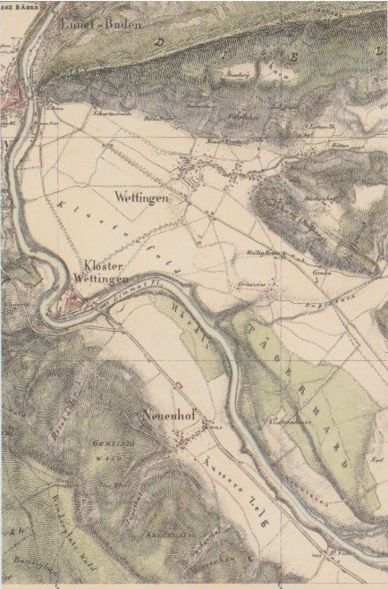
Tafel 3: Ausschnitte aus der Michaeliskarte (1827/431) und der Singfried-karte (1881, 1904, 1914, 1931, von links nach rechts), 1:25000.