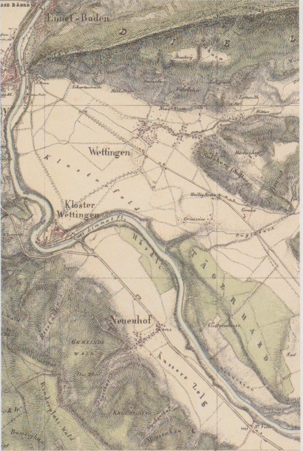
Tafel 3: Ausschnitte aus der Michaeliskarte (1827/43) und der Siegfriedkarte (1881, 1904, 1914, 1931, von links nach rechts), 1:25000.