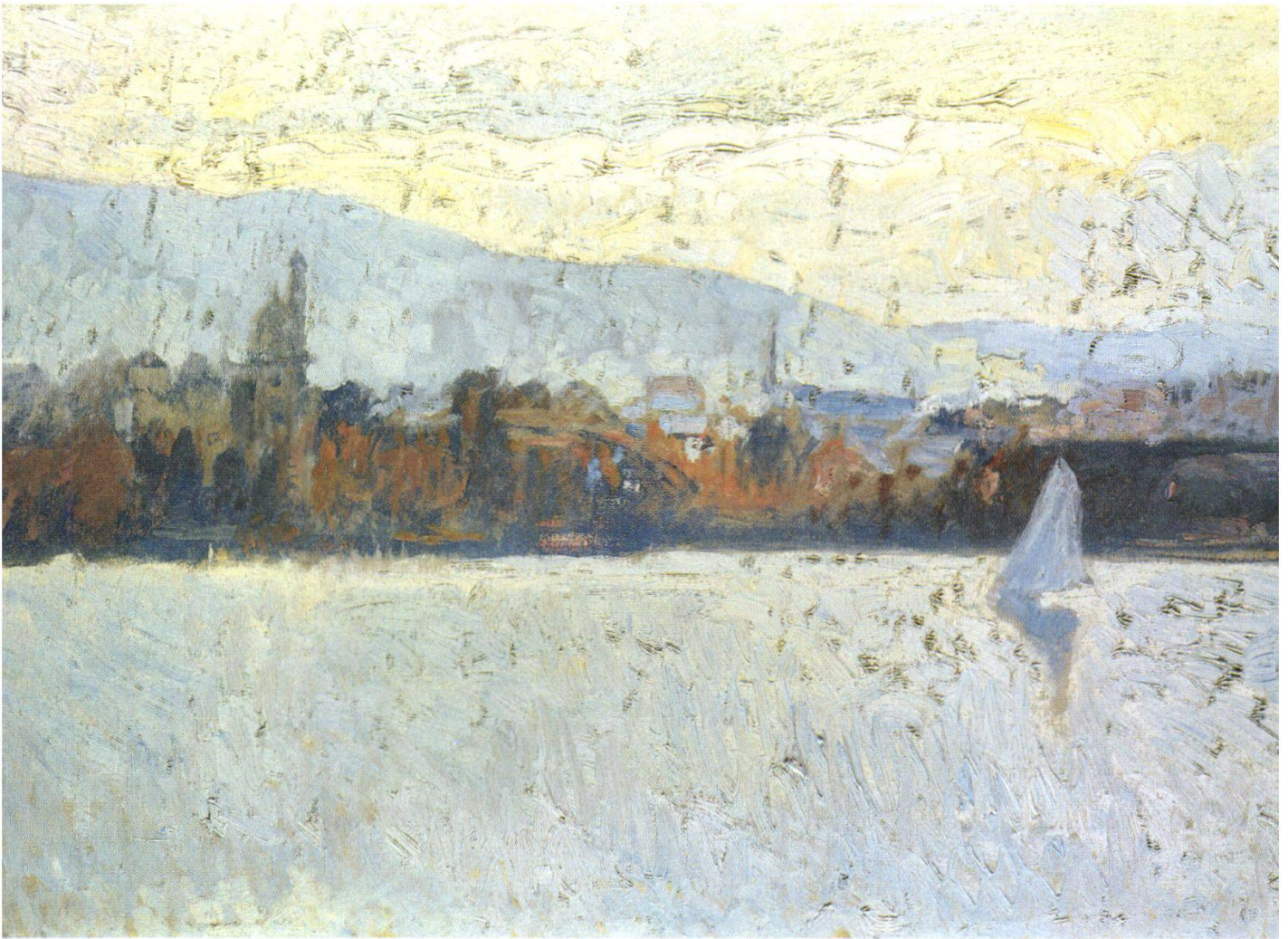
Zürichsee mit Segelschiff