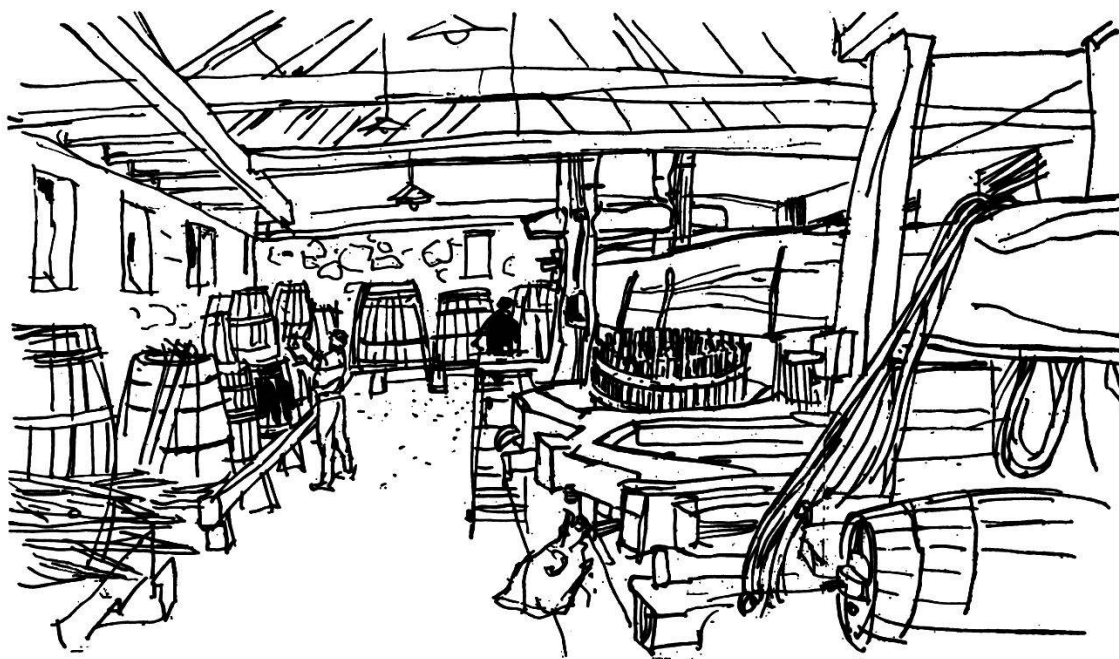
Die alte Goldwandtrotte

nicht etwa angelegt, um das Begehen des Weinbergs zu erleichtern. Nein, es sind mit Schlamm-sammlern verbundene Schwemmtreppen, die während heftigen Gewittern jene nassen Massen, die früher den Weinberg überfluteten, sicher aus dem Bereich der Gefährdung weggleiten. Mit solchen und anderen modernen Einrichtungen, wie den automatischen Pumpen zum Spritzen der Reben, beweisen die Weinbergbesitzer, dass sie gesinnt sind, ihr Reb Gelände nach den neuesten Grundsätzen und wissenschaftlichen Erkenntnissen zu bebauen und so aus ihren Burgundertrauben einen kultivierten Wein herzustellen. Die rund zwölf Hektaren Reb Gelände des «Goldwändlers» nach Möglichkeit zusammenzuhalten – zu viel ist schon überbaut worden! – ist auch das Bestreben der «Weinbaugenossenschaft Ennetbaden», die seit dem Beginn der fünfziger Jahre unter der Betreuung eines kundigen Trottmeisters und Präsidenten die Trauben verschiedener Rebbergsbesitzer einkauft und die in ihrer Trotte und in ihren Kellereien für einwandfreie Güte der Kelterung, der Lagerung und endlich des Weines selber bürgt.