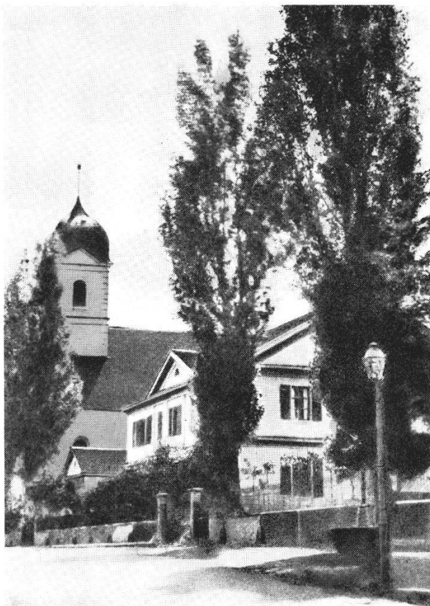
Abb. 6 Der Egloffstein um 1875. Die Photographie zeigt die Ostseite des Hauses. Besonders eindrucksvoll sind die Pappeln.