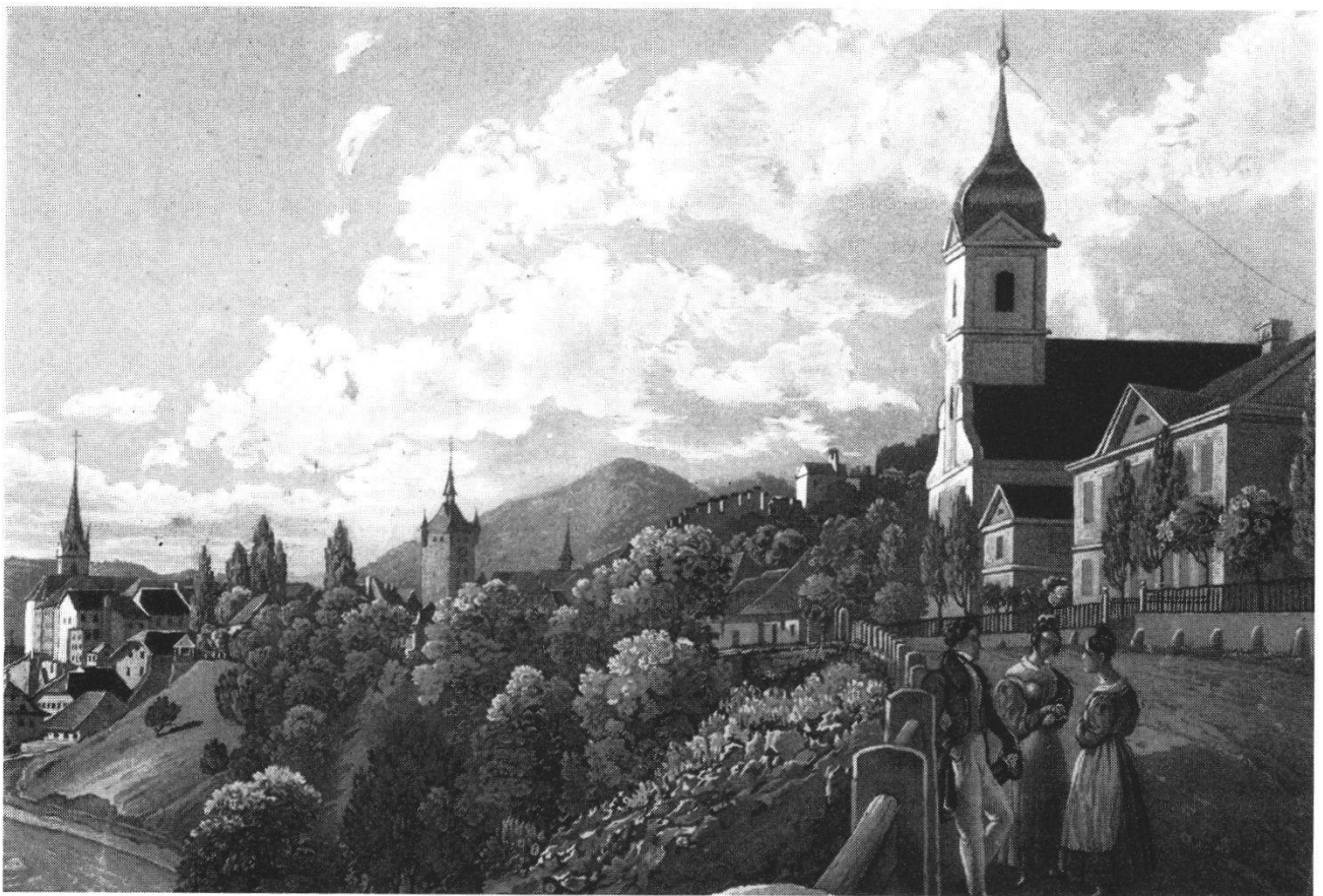
Abb. 4 Der Egloffstein um 1840. Ausschnitt aus einem Aquatintastich von J. Speerli nach einer Zeichnung von J. Mayer-Attenhofer. Man erkennt deutlich, daß die Seitengebäude ursprünglich zweistöckig waren.