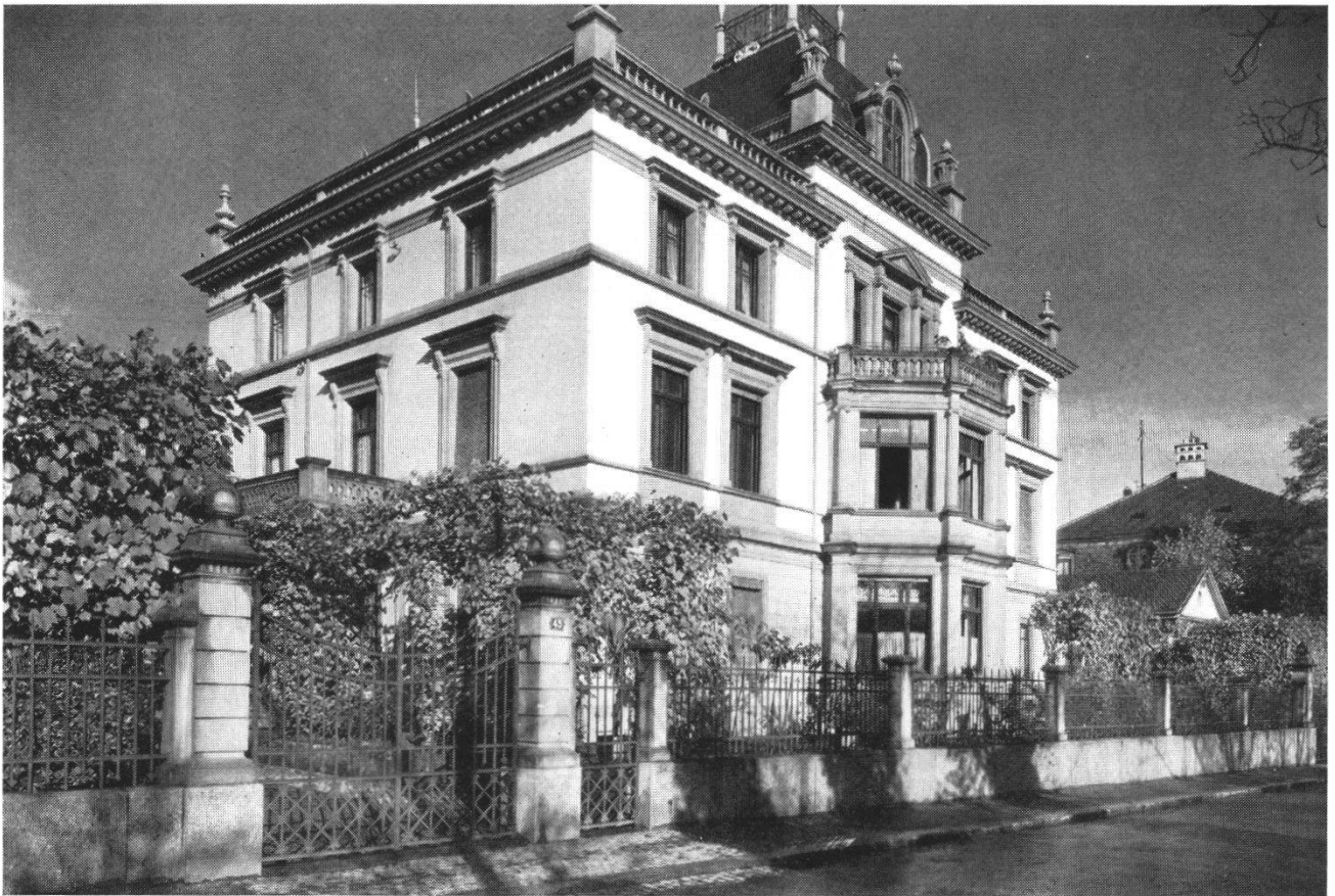
Abb. 8 Der Egloffstein nach dem Umbau um 1900. Das Haupthaus und die Garteneinfriedung sind völlig verändert. Der durch Robert Dorer erfolgte Umbau atmet den Geist des Jugendstils.