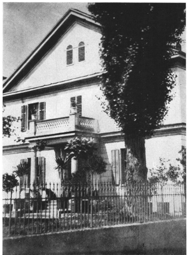
Abb. 7 Der Egloffstein um 1875. Die Photographie zeigt die Südseite des Hauses. Der Säulenvorbau mit Balustrade dürfte aus dieser Zeit sein.