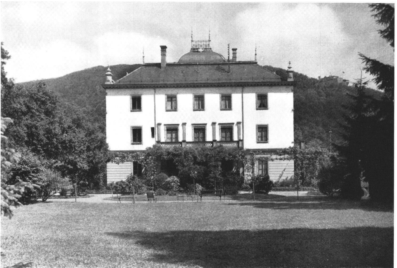
Abb. 9 Der Egloffstein nach dem Umbau um 1900. Am Haus sind beim ersten Stock noch die Pilaster des alten Egloffstein erkennbar. Der Säulenvorbau dürfte aus den 70er Jahren stammen. Die Aufnahme besticht besonders durch die prachtvolle Weiträumigkeit des Parkes.