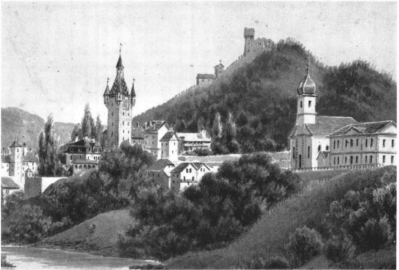
Abb. 3 Der Egloffstein im Jahre 1831. Originalgouache von J. Dubois. Diese Ansicht zeigt den Egloffstein kurz nach seiner Erbauung. Die Limmatpromenade besteht noch nicht; sie wurde 1832 eingeweiht.