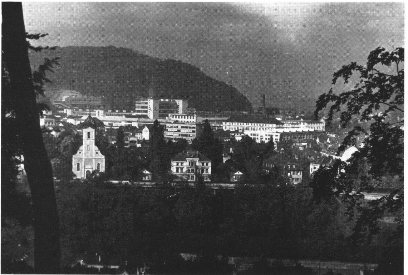
Abb. 2 Der Egloffstein und seine Umgebung um 1957. Der Egloffstein ist zwar umgebaut, aber die beiden Seitengebäude und der Park erinnern noch an die Vergangenheit. Wie eine Vision der neuen Zeit ragen im Hintergrund die Fabrikbauten des neuen Baden empor.