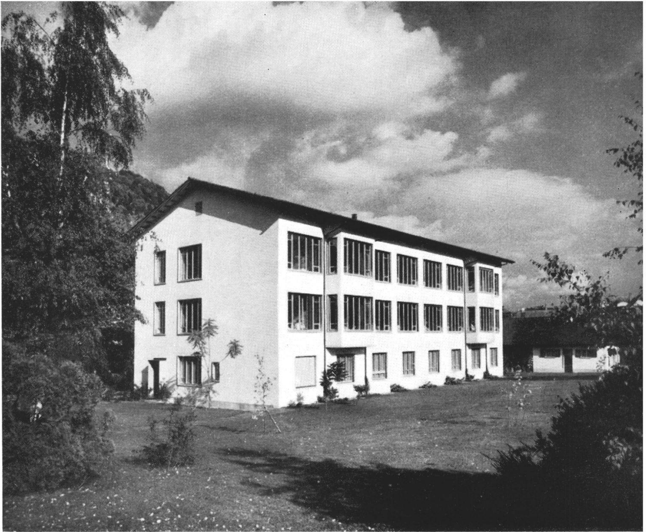
Infektionshaus des Städtischen Krankenhauses Baden 1952