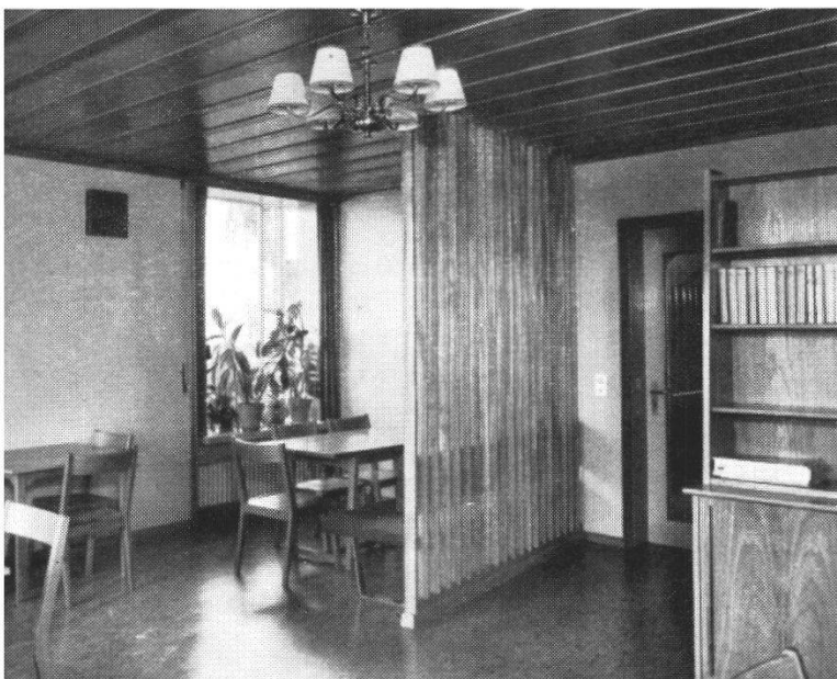
Wohnzimmer im Schwesternhaus