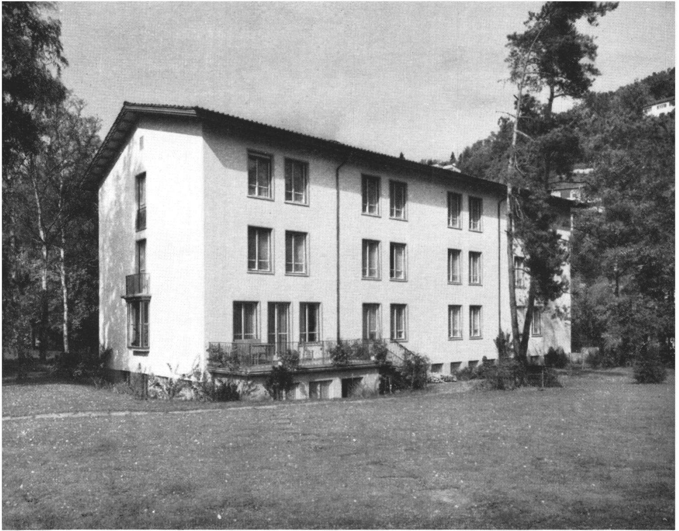
Schwesternhaus von Osten