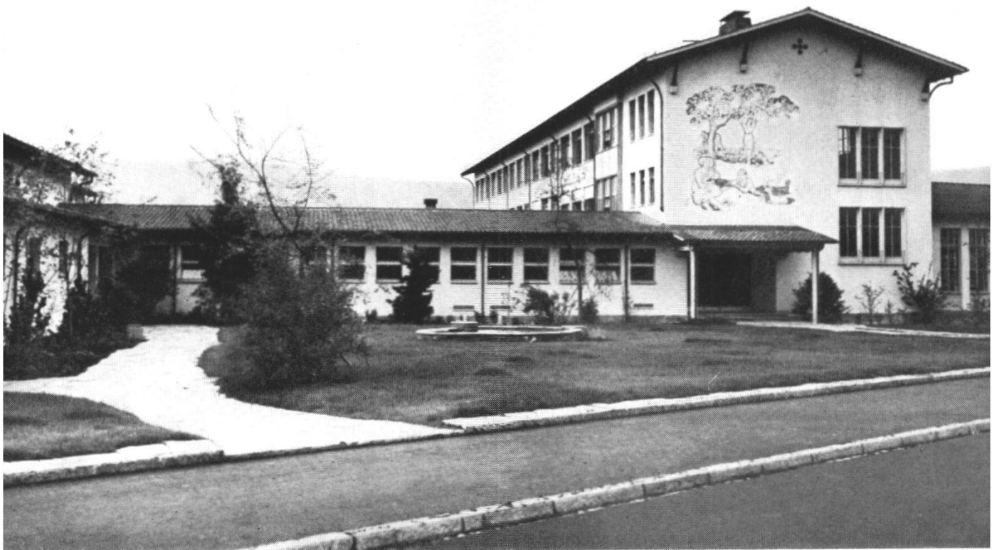
Schulhaus Altenburg Wettingen. Brunnenfiguren und Sgraffito von Eduard Spörri.