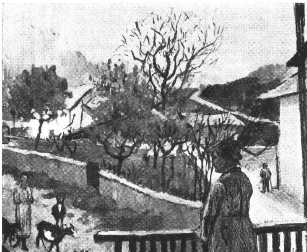
Giovanni Giacometti, 1868-1933 Herbst in Stampa