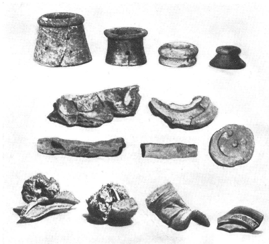
Römische Töpfereien in Baden: Brennständer, Brennwürste und Fehlbrandware