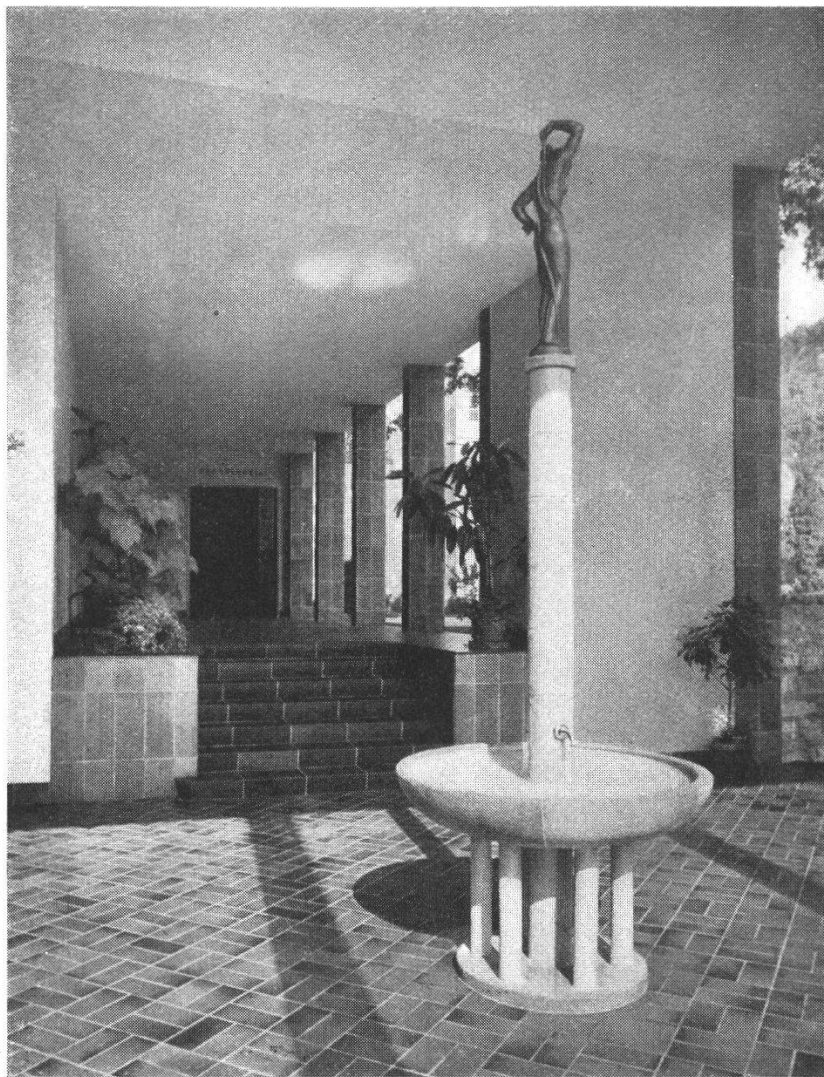
Trinkbrunnen mit Blick in die Wandelhalle

Schöpfung des Erbauers der Gesamtanlage, Architekt O. Dorer von Baden. Den Brunnen krönt eine graziöse, von unserem Bildhauer H. Trudel geschaffene, dem Bade entsteigende Frauengestalt. Vor der Trinkhalle breitet sich gegen die Limmat hin ein weiter Rasenplatz aus, der einige Meter höher liegt