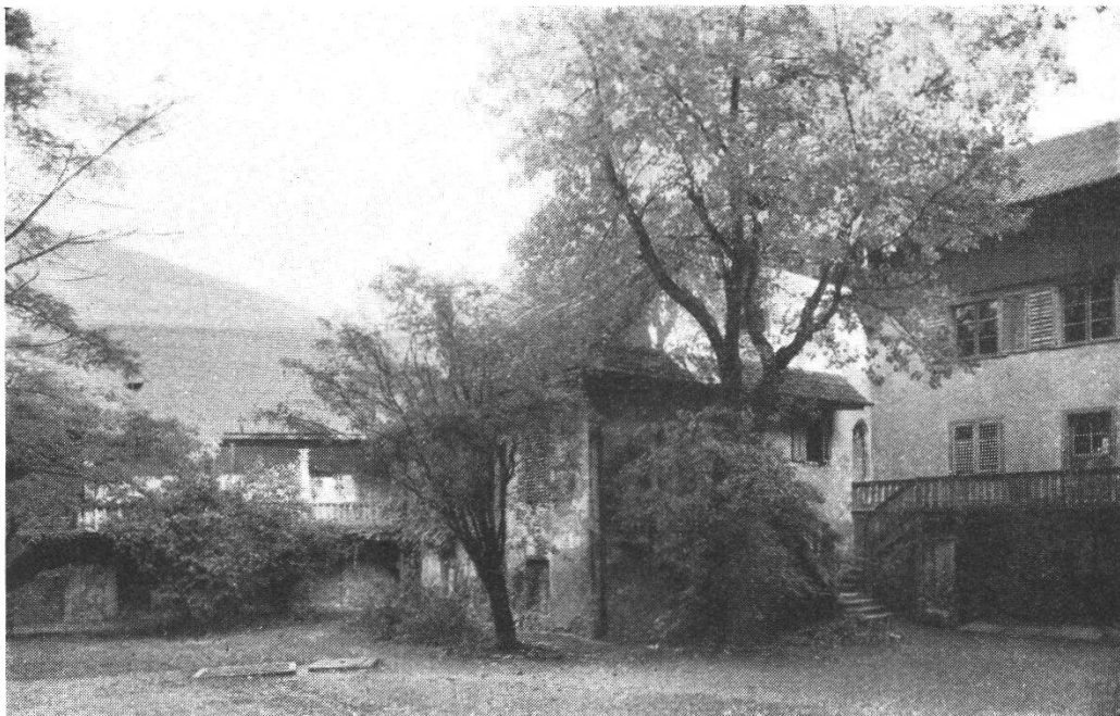
Teilansicht im alten Stadthof