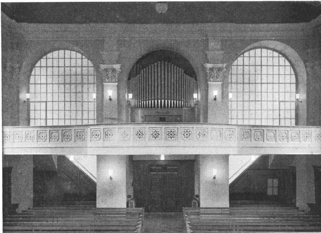
Ansicht der umgebauten Empore und Orgel

Es darf deshalb mit Genugtuung festgestellt werden, dass der Umbau des Orgelwerkes einen vollen Erfolg bedeutet und das Kircheninnere, wie die Abbildung zeigt, gewonnen hat.