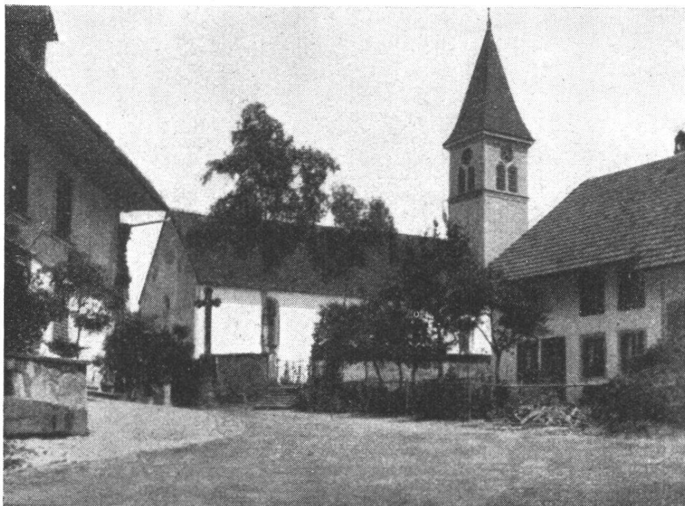
Die alte Kirche von Birmenstorf, die abgebrochen wird.