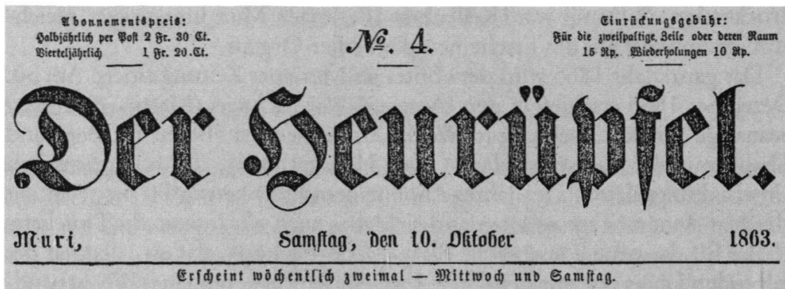
Titel des Heurüpfel aus Muri vom 10. Oktober 1863 (Hugo Müller, Muri).

rung war und das gleichnamige Blatt derselben Richtung angehörte. 79 Dieser Schluss ist nicht zwingend. Auch das Lehrerseminar und die Kantonschule waren zeitweise der offenen Kritik freisinniger Persönlichkeiten ausgesetzt, die sich in der Presse äusserten. Dies erfolgte vorzüglich, wenn unliebsame Direktoren und Professoren, Verschleuderung von Steuergeldern oder Dünkelhaftigkeit der Schüler mit im Spiele waren. Daher wehrten sich die Initianten des «Heurüpfel» auch dagegen, als blosser Kritiker der landwirtschaftlichen Bildungsanstalt abgestempelt zu werden.